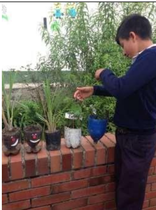
Imagen 13. Los estudiantes con sus plantas sembradas en materos elaborados con material reciclable..