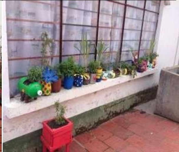
Imagen 20. Plantas resemb radas listas para armar nuestro jardín medicinal.