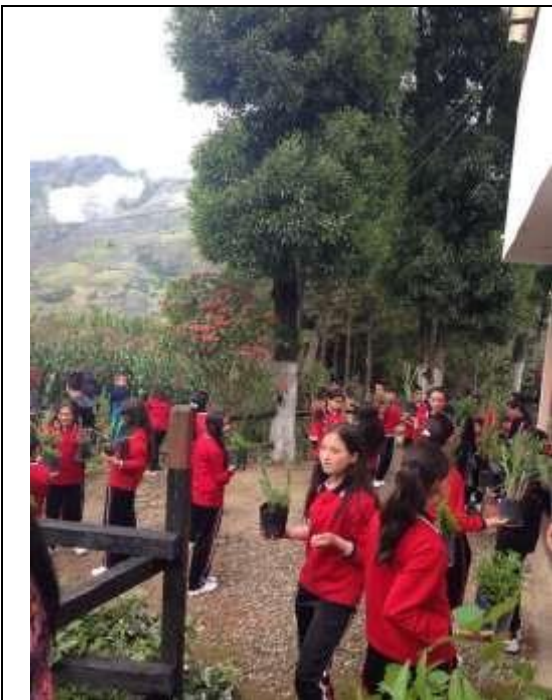
Imagen 12. El grupo recibiendo plantas para sembrar.