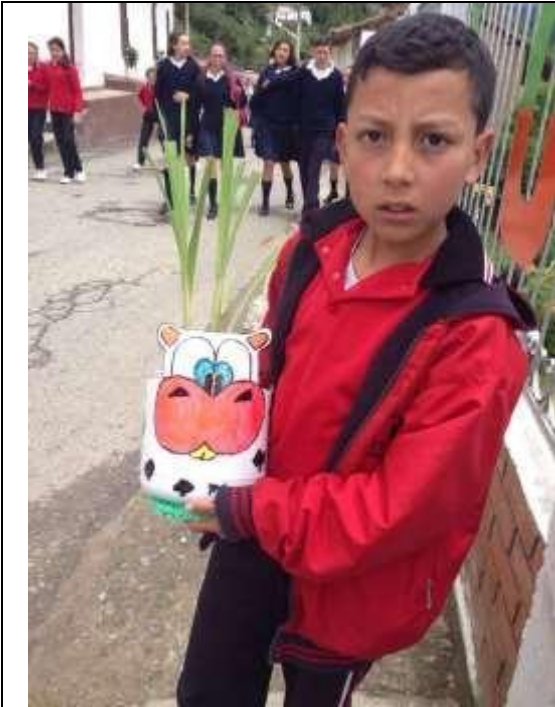
Imagen 16. Cada estudiante decora su matero.