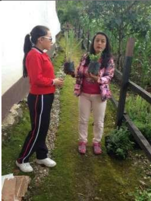
Imagen 10. La docente líder entregando plantas para resembrar.