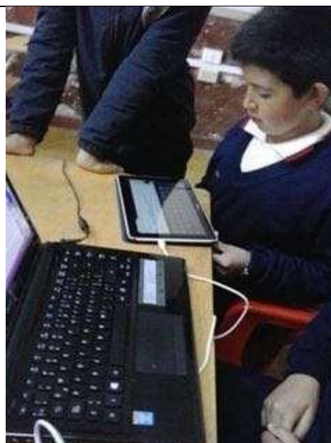
Imagen 5. Registrando los integrantes del grupo en la comunidad.