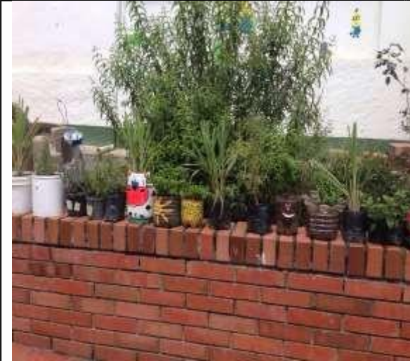
Imagen 19. Plantas resemb radas listas para armar nuestro jardín medicinal.