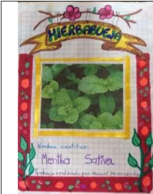
Imagen 8. Plantas registradas en el cuaderno viajero