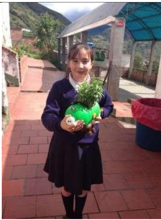
Imagen 15. Cada estudiante decora su matero.