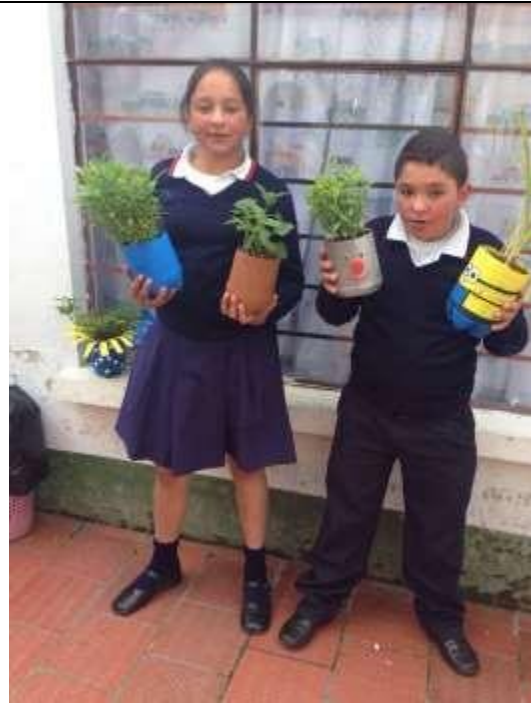
Imagen 17. Cada estudiante decora su matero.