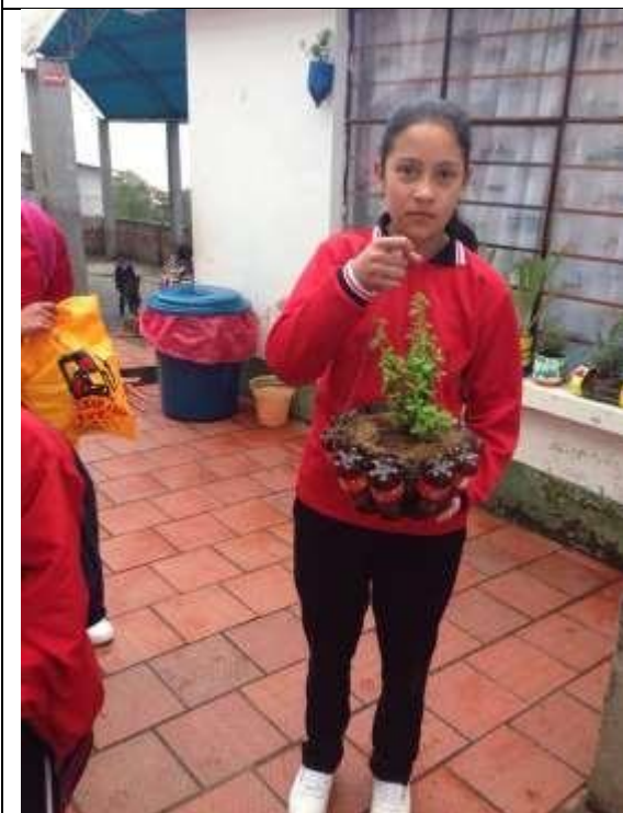
Imagen 14. Cada estudiante decora su matero.