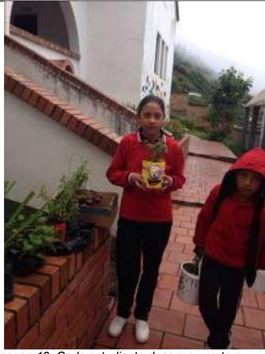
Imagen 19. Cada estudiante decora su matero.