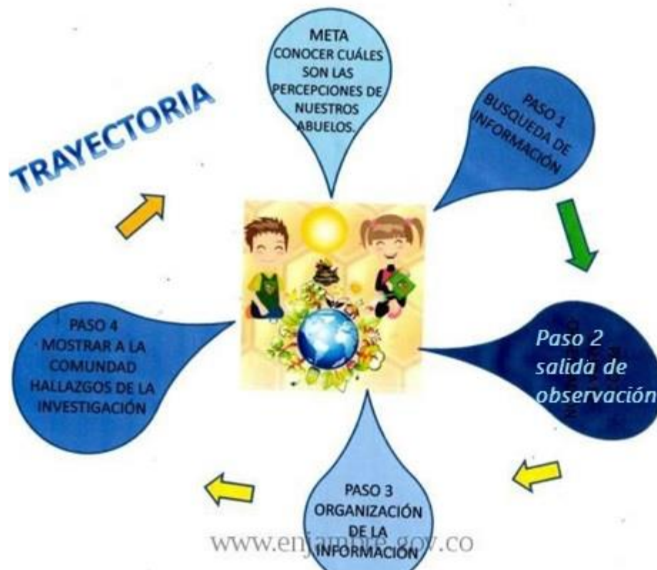
Imagen 3. Trayectoria propuesta por el grupo

El grupo de investigación Puyanenses “Un mundo mejor” centra sus labores en la ejecución de la trayectoria de indagación que plantea desarrollar las siguientes etapas: 1) Búsqueda de información, 2) salida de observación, 3) Organización de la información, 4) Mostrar a la comunidad hallazgos de la investigación.