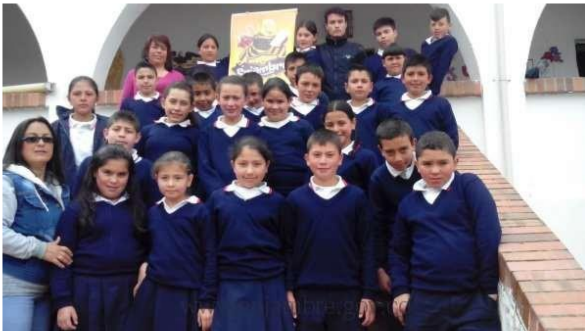
Imagen 2. Grupo de investigación