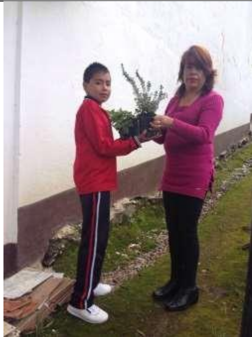
Imagen 11. La docente co investigadora entregando plantas para resembrar.