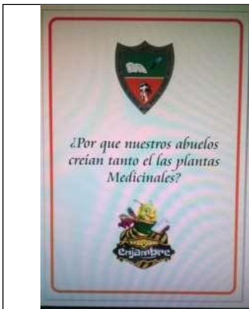
Imagen 4. La pregunta de investigación.

Una vez organizada la información, se muestra a la comunidad los hallazgos de la investigación por medio de plegables. Además se deja en el colegio un jardín medicinal o sitio donde se puedan observar las plantas más comunes y tradicionales de la cultura silera.