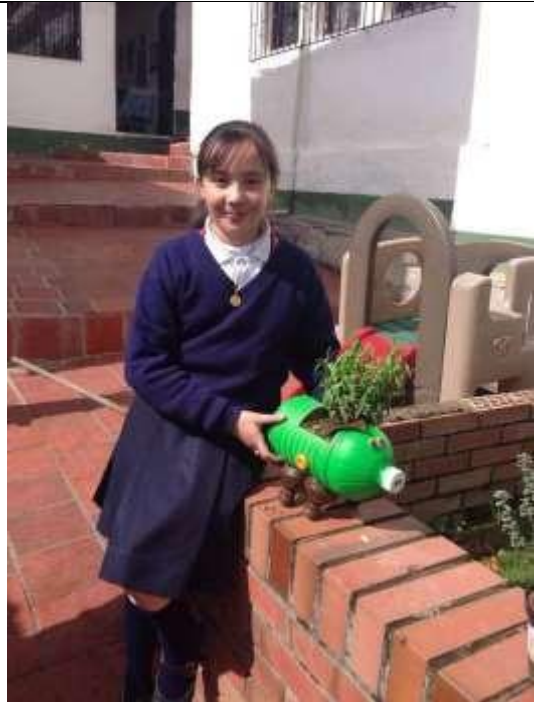
Imagen 18. Cada estudiante decora su matero.