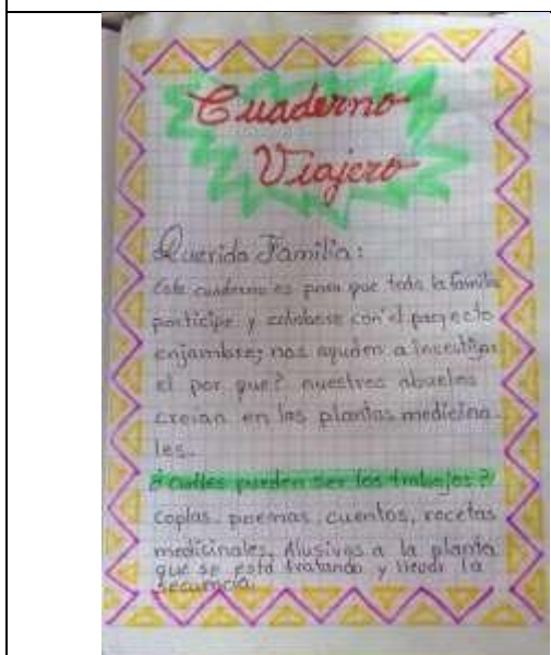
Imagen 6. Cuaderno viajero