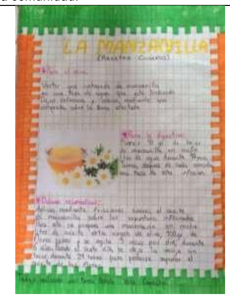
Imagen 7. Recetas consignadas en el cuaderno viajero