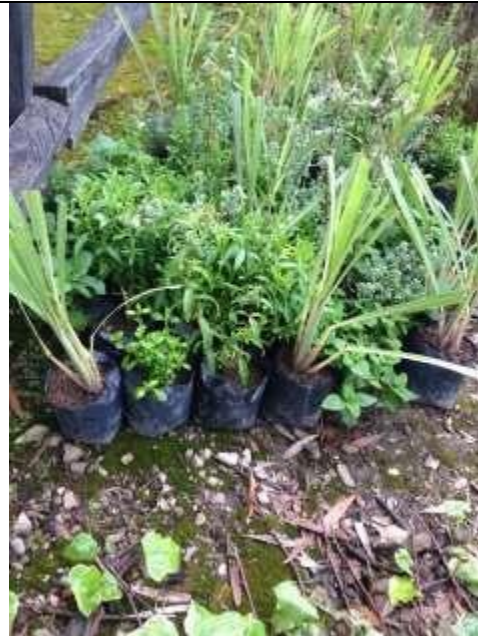
Imagen 9. Plantas medicinales para realizar proceso de resiembra.