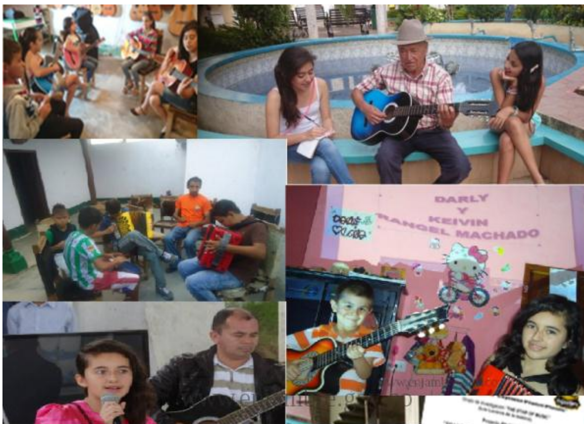
Salidas a campo presentaciones, entrevistas.

Las salidas a campo realizadas para para obtener información fueron salida a la vereda Guamalito para prestación de muestra cultural, además también el grupo presento sus avances tanto en las feria institucional y actos culturales en la institución educativa.