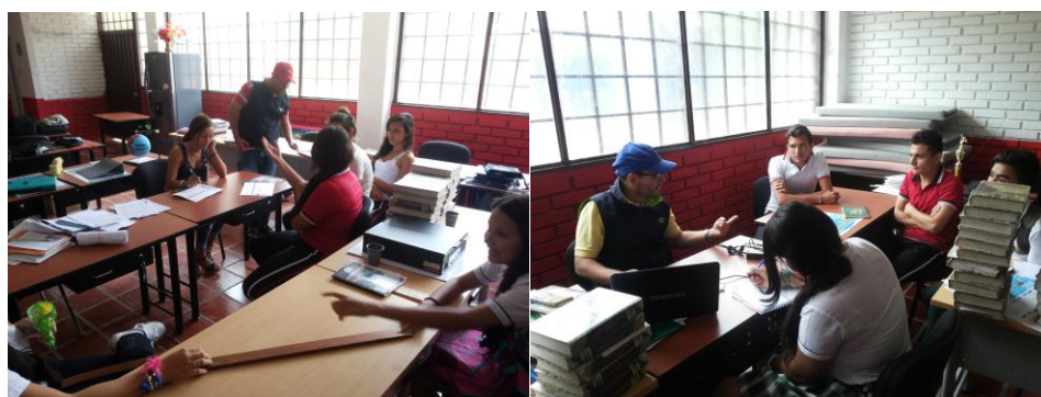
Planeación de actividades