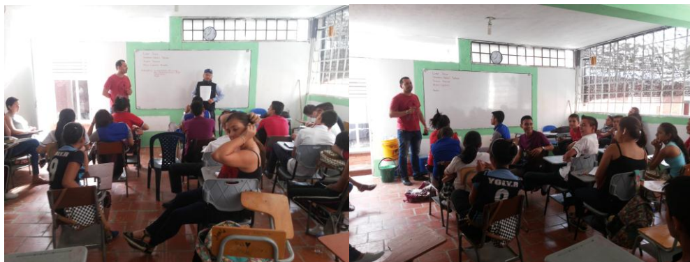
Conformando el grupo de investigación