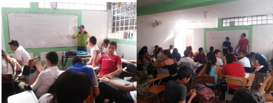
Planeando el cronograma de actividades