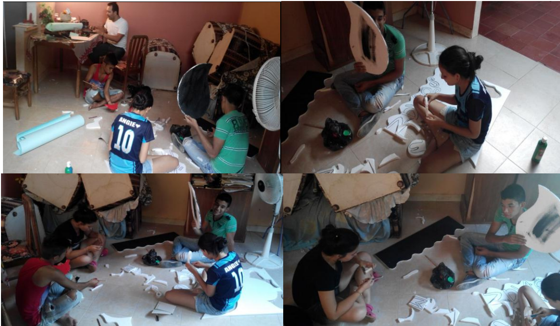
Elaborando trabajos con material reciclable