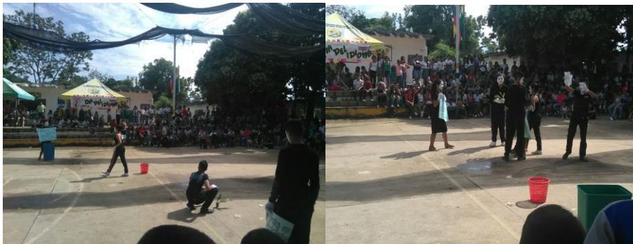
Campaña de concientización