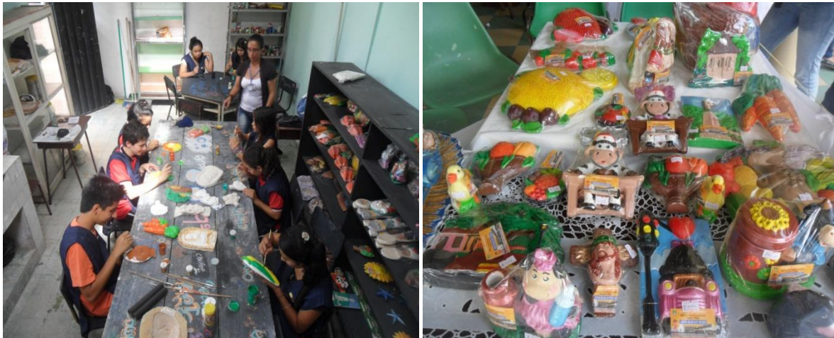
PRODUCCIÓN ARTISTICA DEL PROYECTO: "EXPLORADORES DEL ARTE"