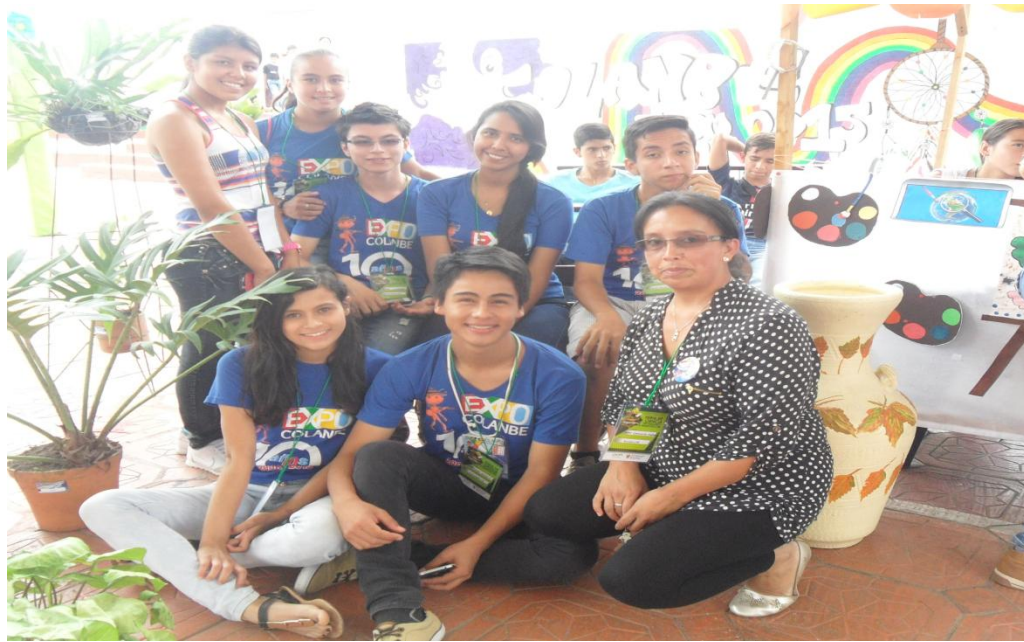
FOTO DEL GRUPO DE INVESTIGACIÓN