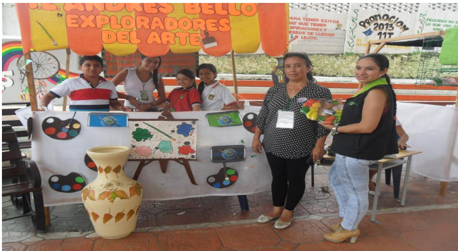
PARTICIPACIÓN DEL PROYECTO EN FERIA INSTITUCIONAL