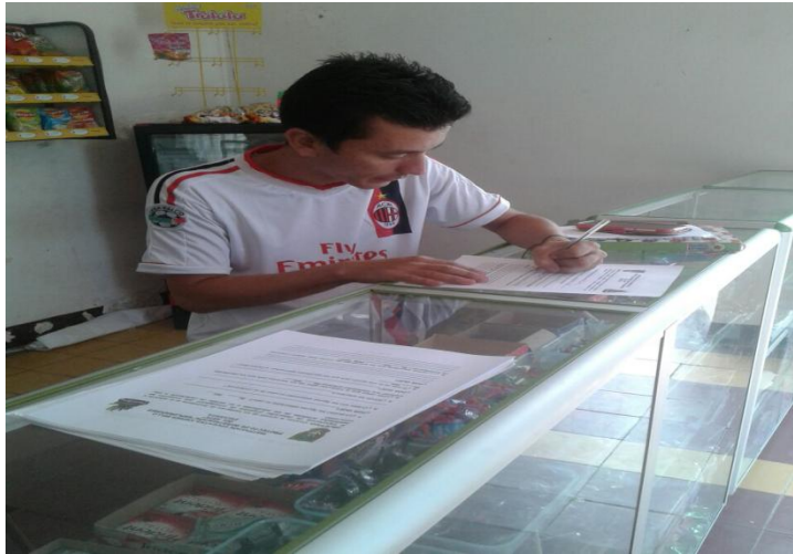
SALIDAS DE CAMPO: APLICACIÓN DE ENCUESTA