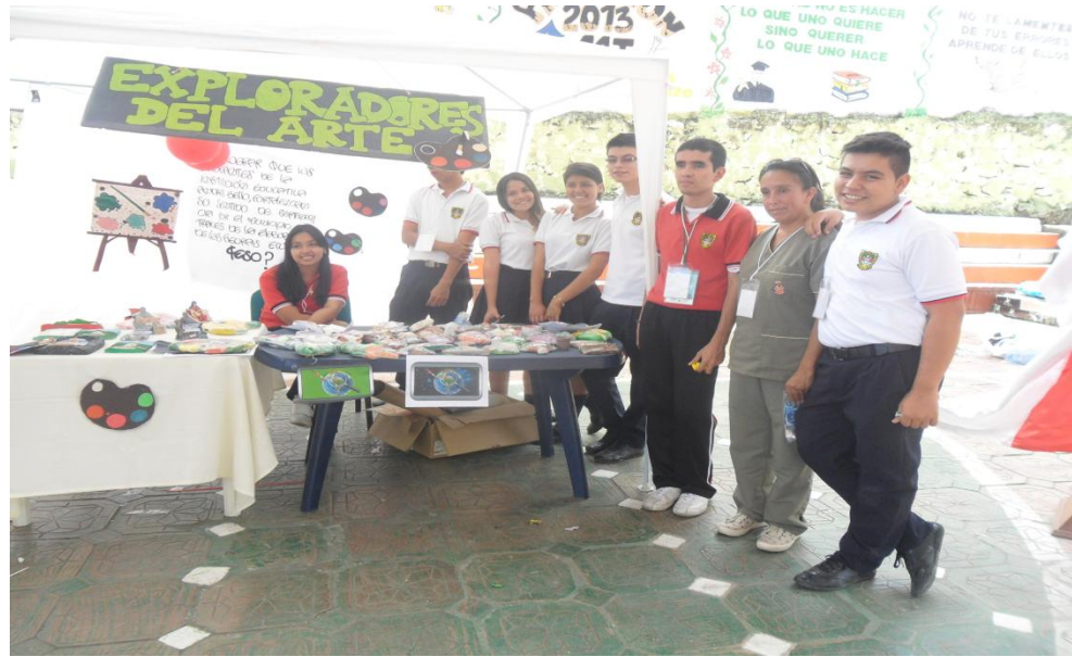
PARTICIPACIÓN DEL PROYECTO EN FERIA MUNICIPAL