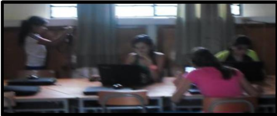
IMAGEN 10: Las investigadoras hacen uso de las Tic para tabular la información obtenida del conteo de las encuestas.