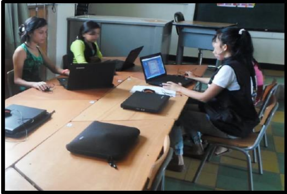
IMAGEN 5: Las investigadoras ingresan a www.enjambre.gov.co y analizan las preguntas de la bitácora 1, buscando la información necesaria las técnicas de investigación.