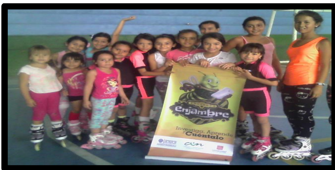
IMAGEN 1: Somos investigadoras del grupo Palma Patín 2015 en Salazar de las Palmas