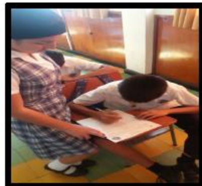
IMAGEN 8: Las investigadoras aplican las encuestas a los compañeros del Instituto Técnico Nuestra Señora De Belén