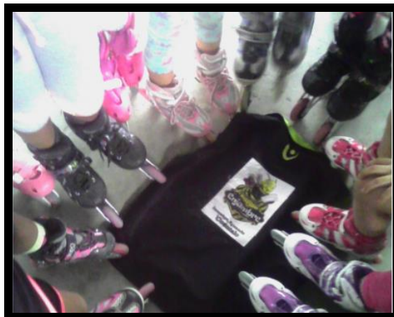
IMAGEN 4: Se consolida el grupo de investigación luego de un proceso de convocatoria