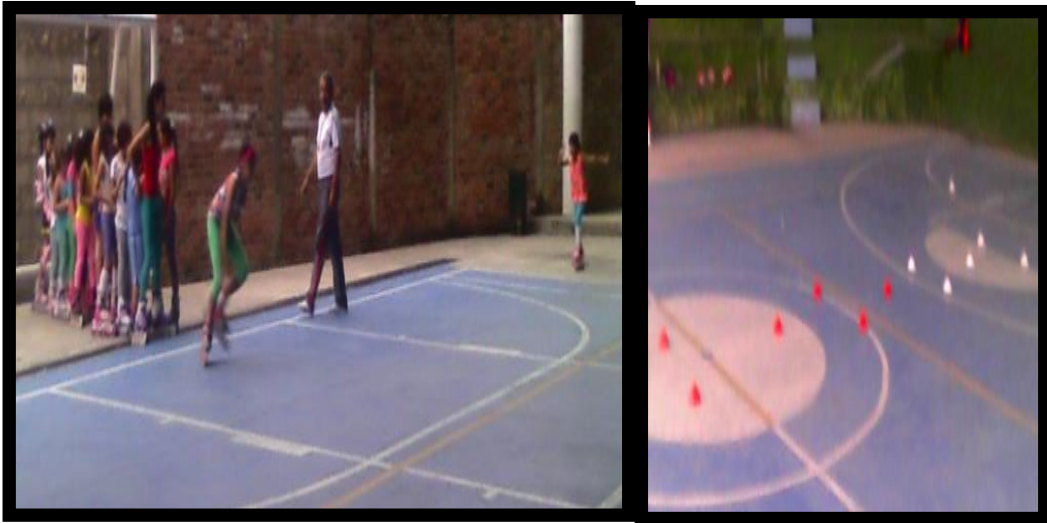
IMAGEN 6: Las investigadoras entrenan para los eventos municipales y de la institución.