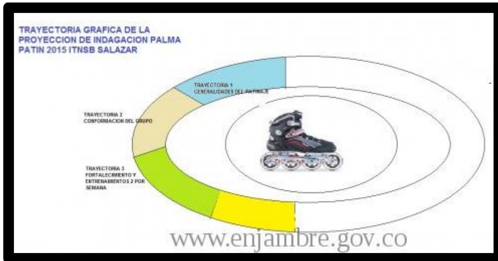
IMAGEN 3: Nuestra trayectoria de investigación