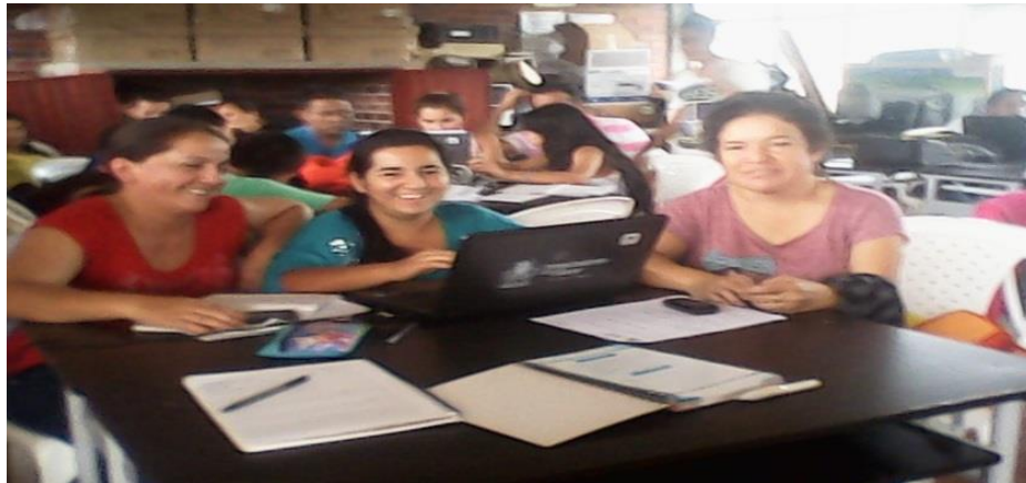
Integrantes del grupo de investigación