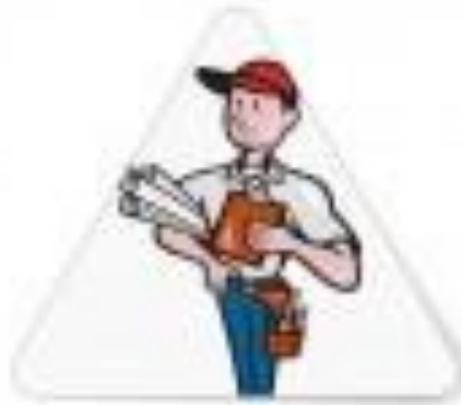
Logo Representativo del grupo de investigación