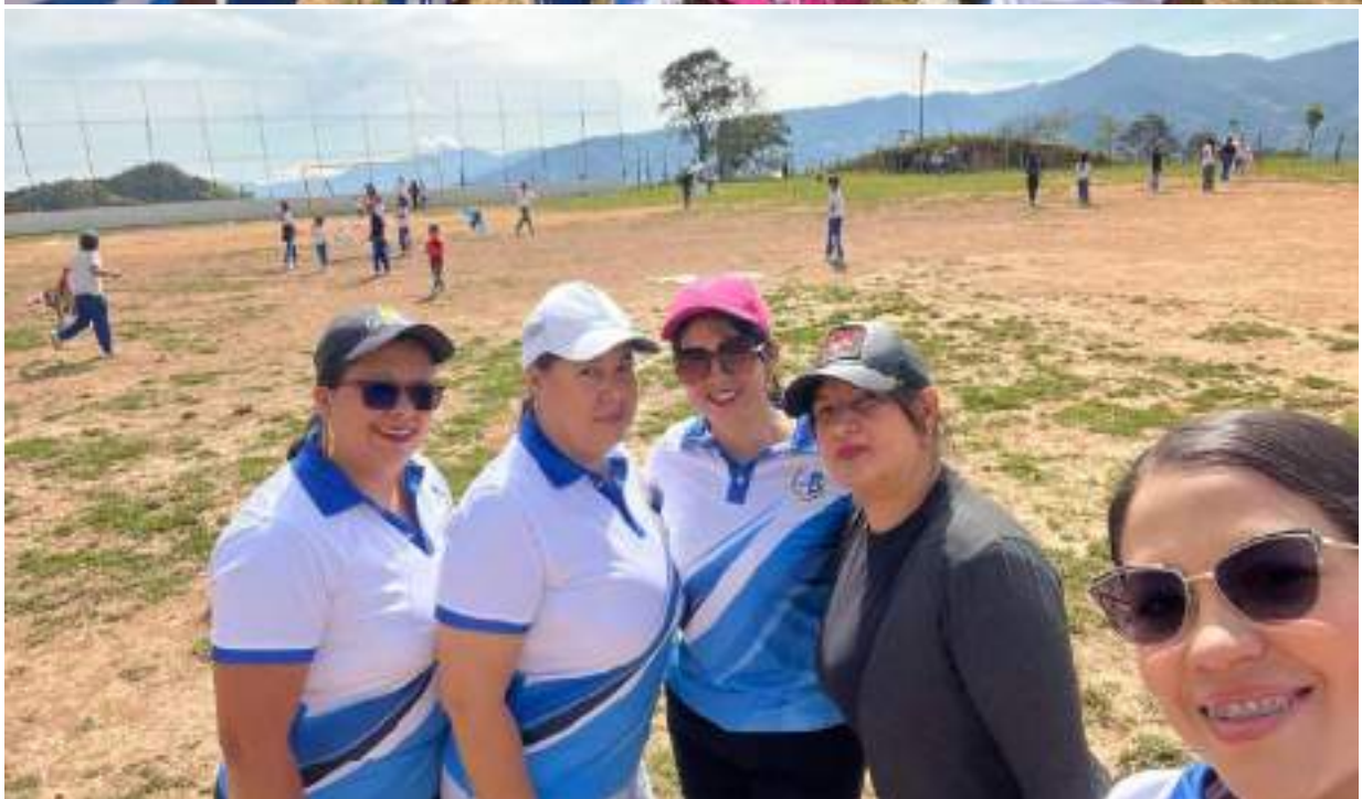
Figura 12. Celebración día de la cometa