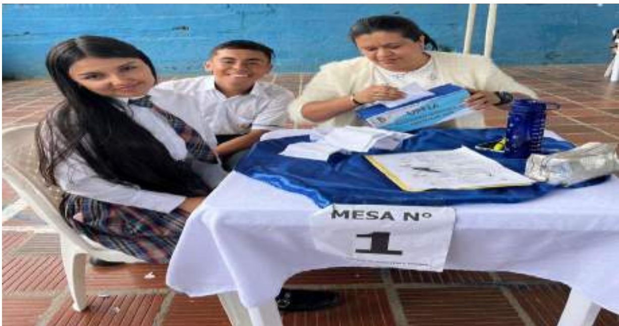
Figura 15. Jornada electoral gobierno estudiantil