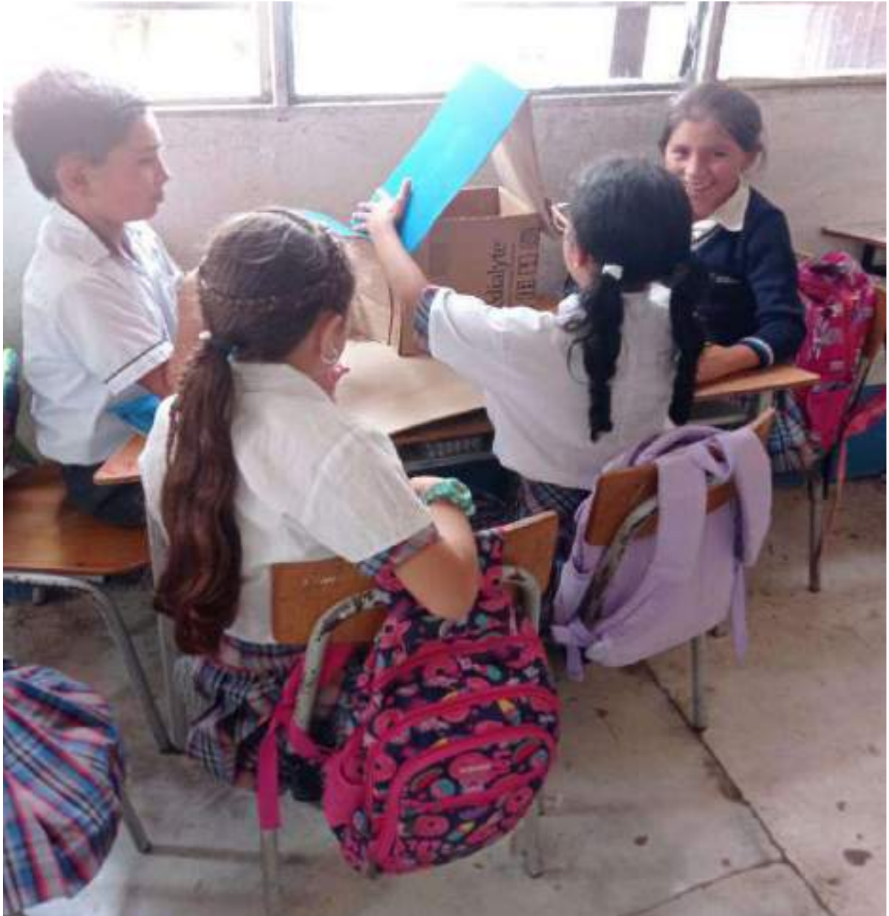
Figura 12. Segunda jornada del Día del Reciclaje