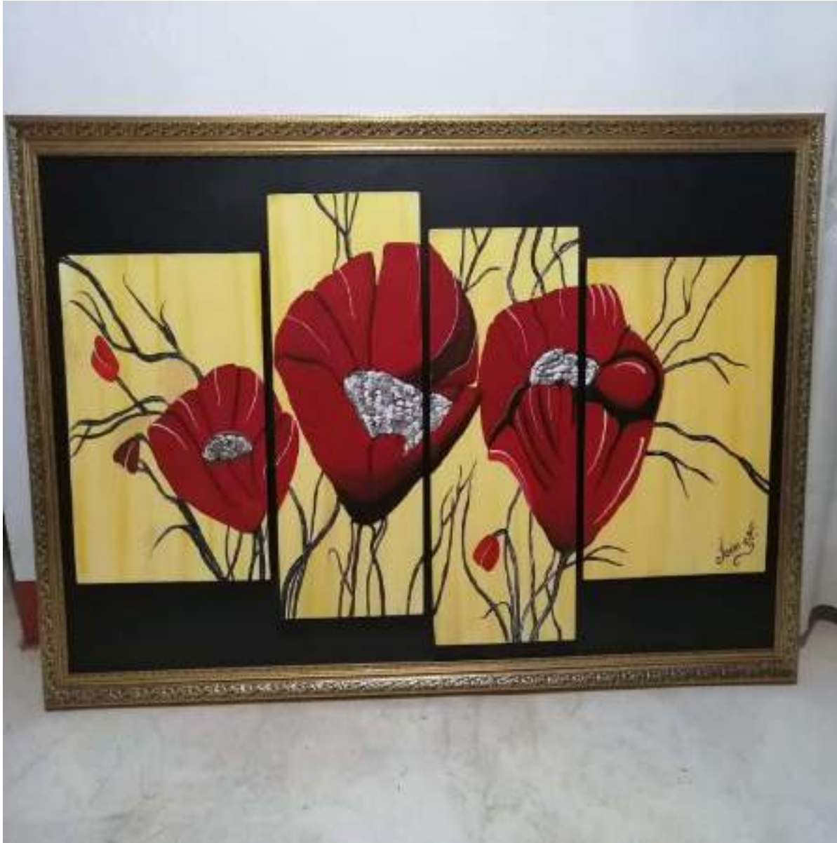
Figura 3. Pinturas decorativas elaboradas por estudiantes