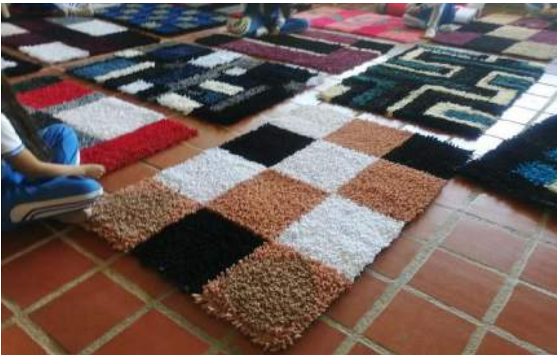
Figura 4. Alfombras elaboradas por estudiantes.