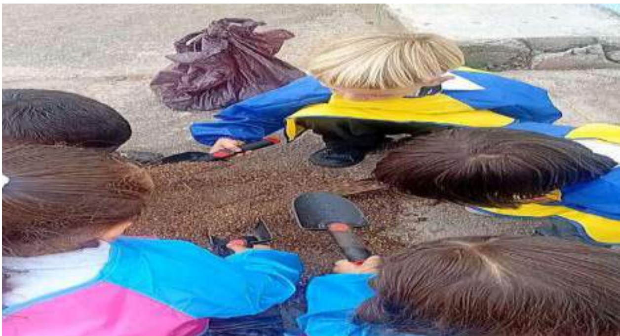
Figura 3. Recolección de residuos sólidos para comercialización y generación de recursos para la banda institucional