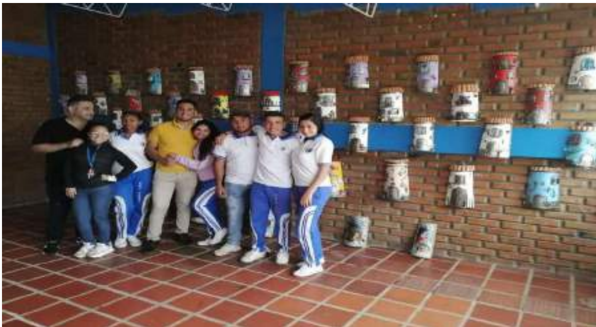
Figura 6. Exposición por parte de los estudiantes y exhibición en el colegio para la comunidad educativa