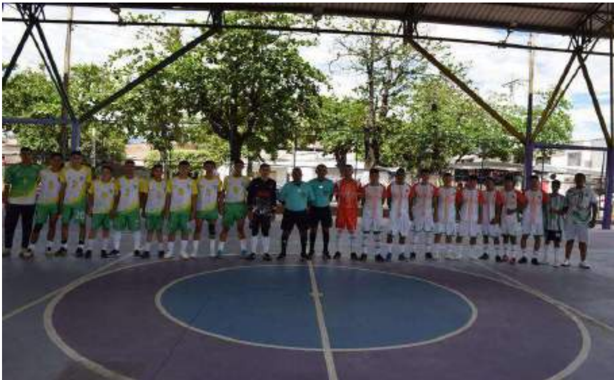
Figura 2. Participación juegos Intercolegiados