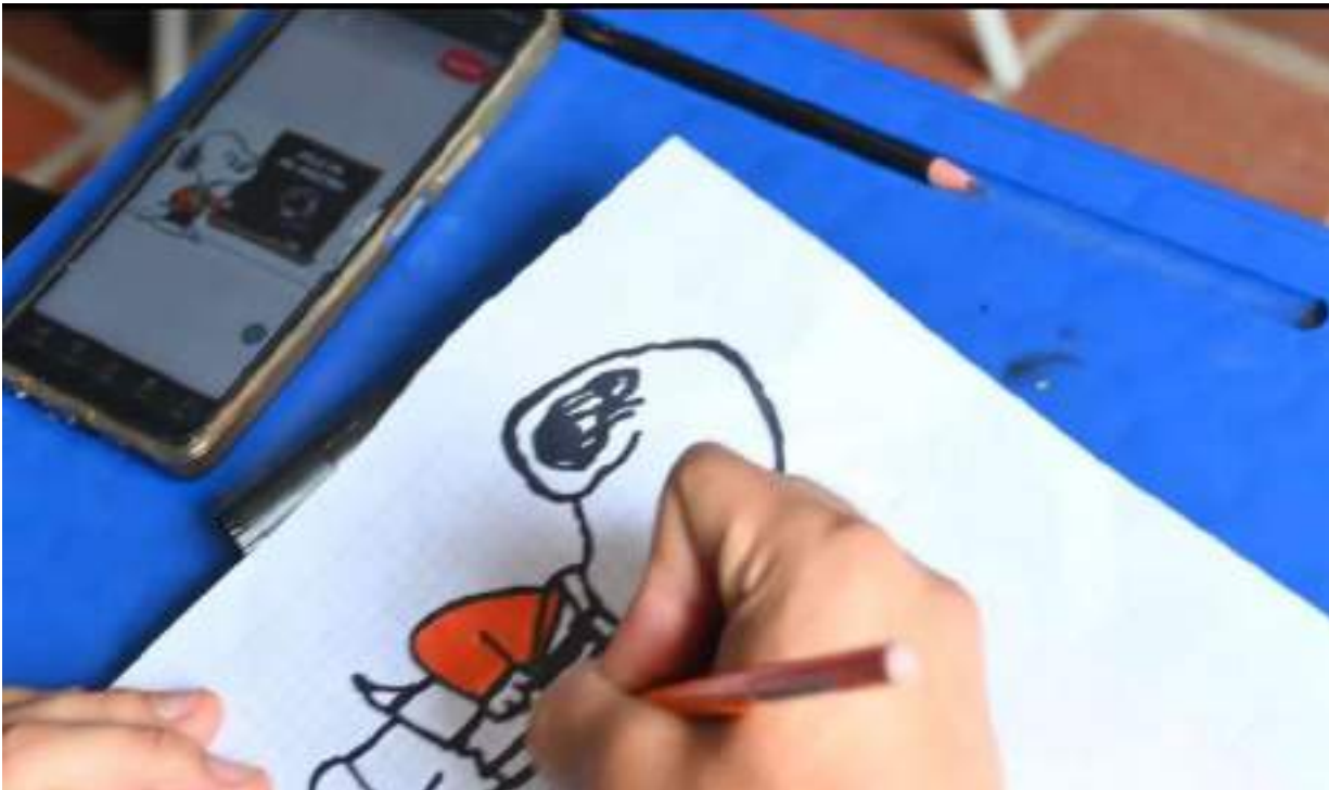
Figura 5. Participación Escuela de Formación en Audiovisuales