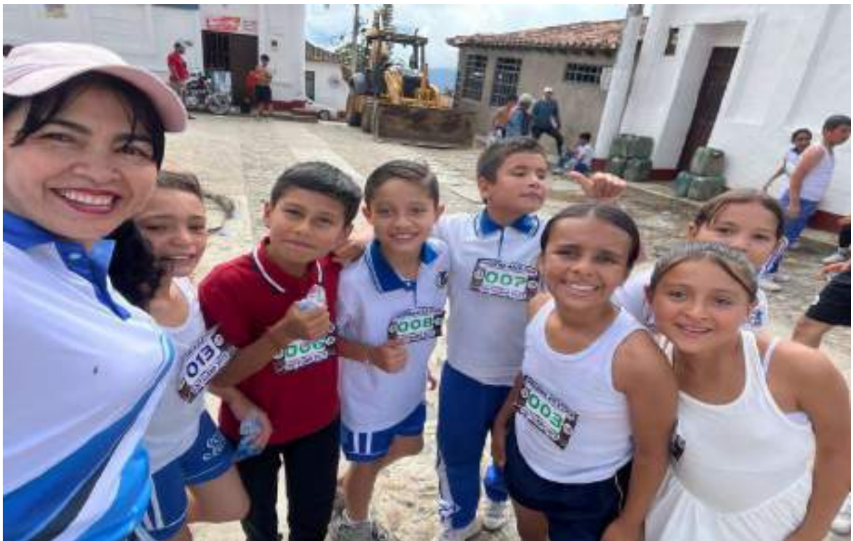
Figura 12. Celebración jornada deportiva y cultural