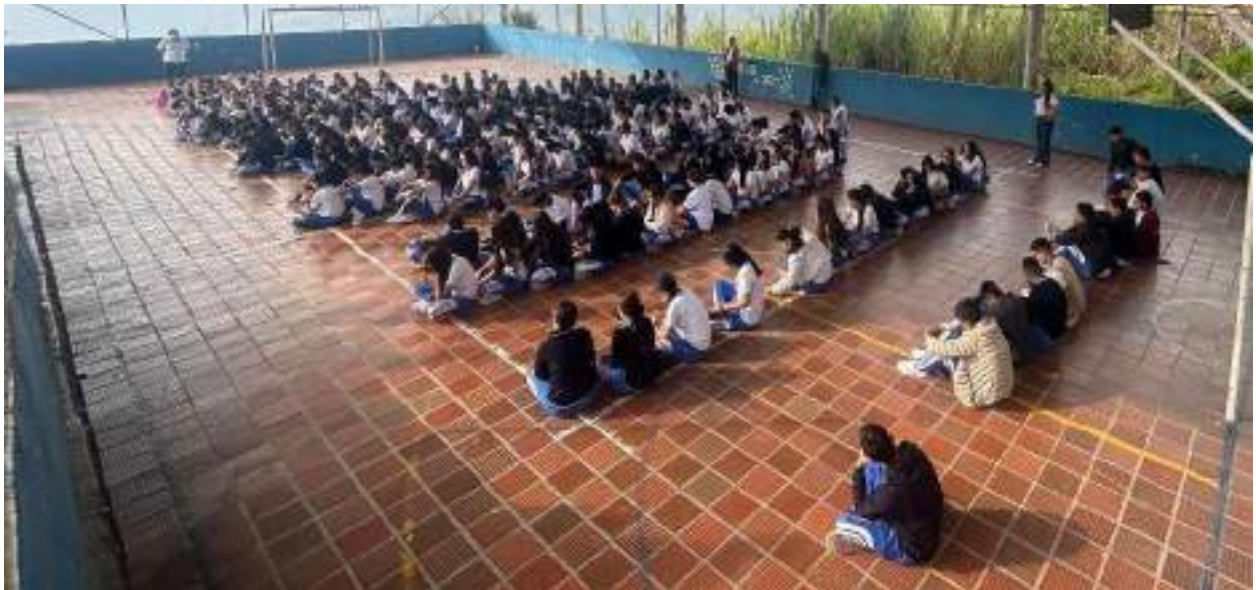
Figura 2. Elección del equipo dinamizador con representantes de cada grado.