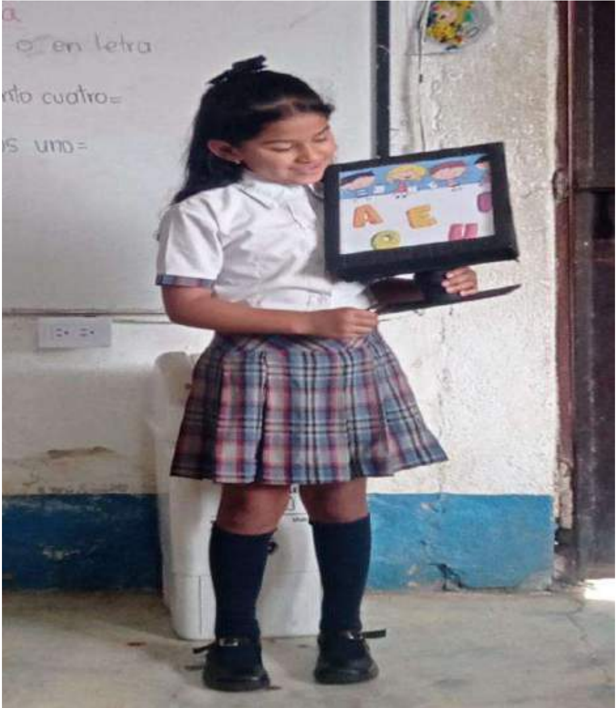
Figura 8. Sensibilización contaminación auditiva