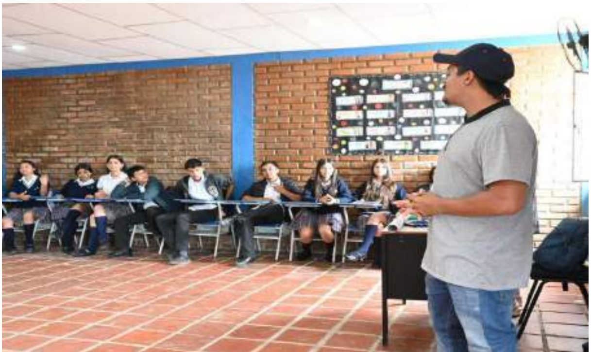
Figura 6. Participación Escuela de contenidos audiovisuales con las Secretaría de Cultura