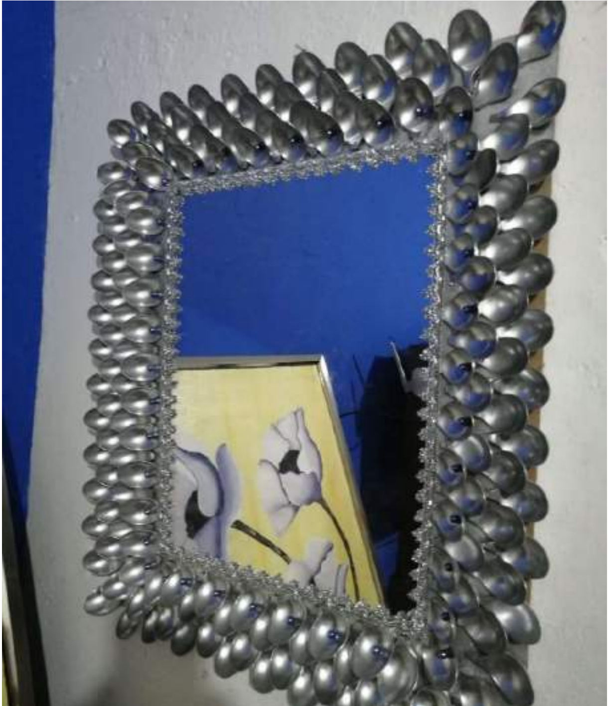
Figura 7. Exposición por parte de los estudiantes de cuadros en material reciclable