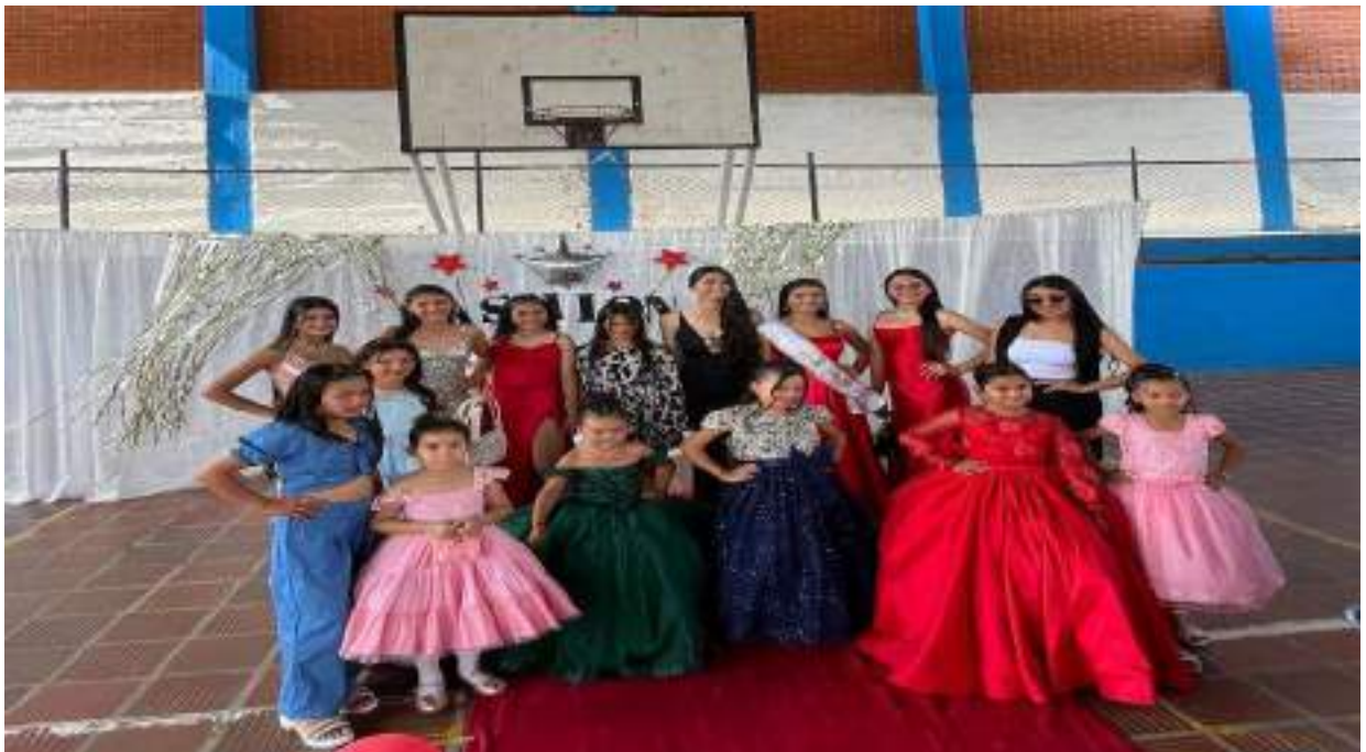
Figura 10. Celebración Día del Estudiante