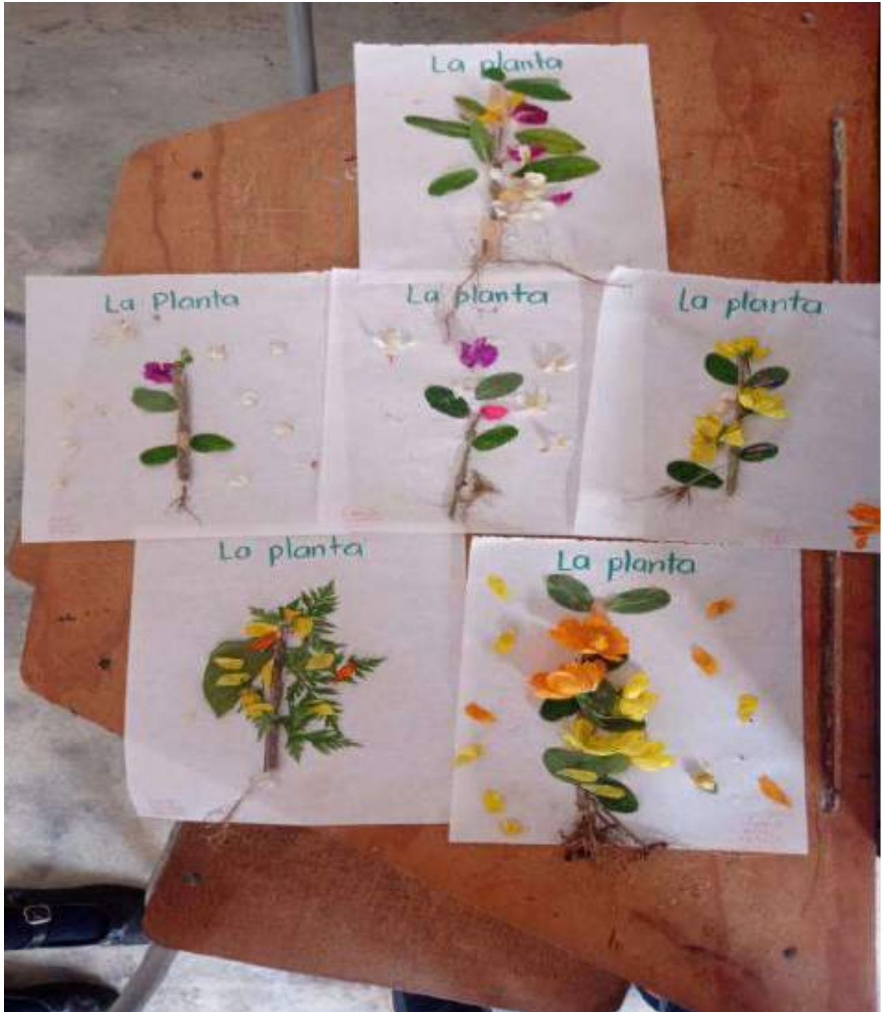
Figura 11. Tercera jornada de embellecimiento.