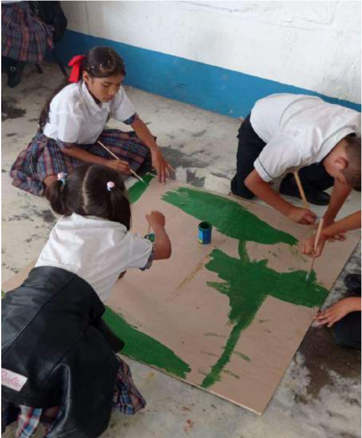
Figura 7. Celebración Día del Árbol