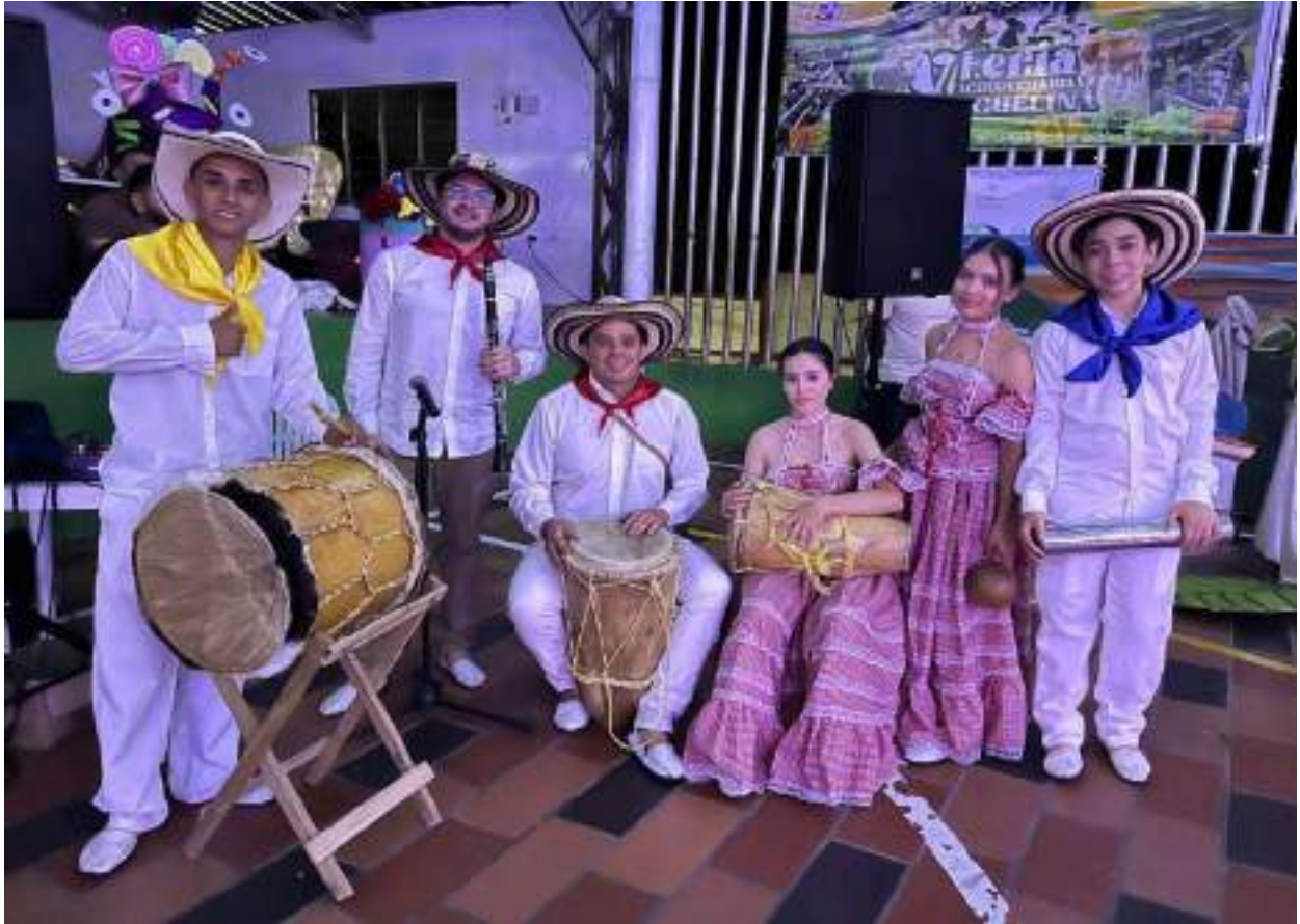
Figura 4. Participación Grupo de Tambores Fiestas patronales municipio de Hacarí