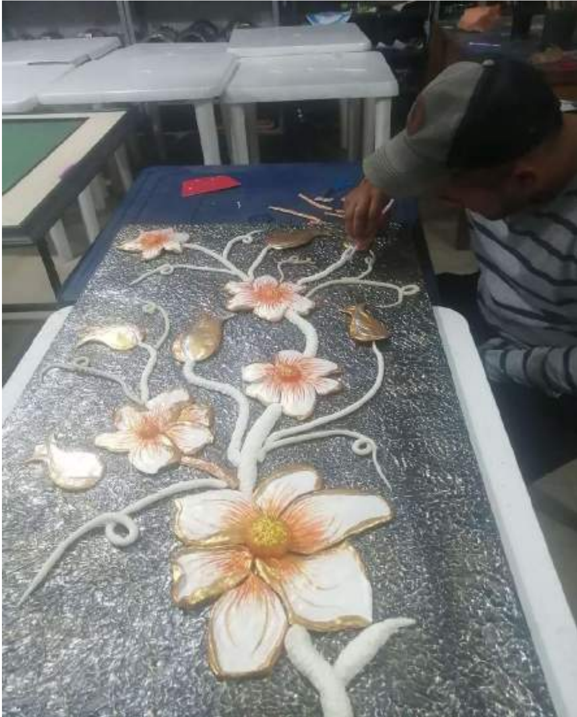
Figura 5. Elaboración de cuadros ornamentales.