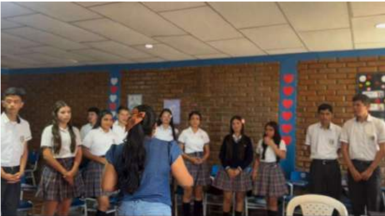
Figura 1. Fortalecimiento el primer colectivo Audiovisual del corregimiento de Aspasica