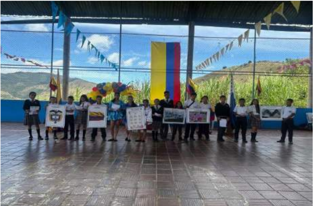
Figura 2. Conmemoración Fiesta de la Independencia (20 de julio)