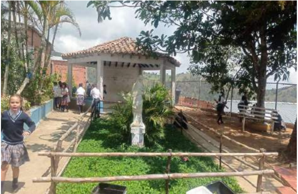
Figura 10. Segunda jornada de embellecimiento