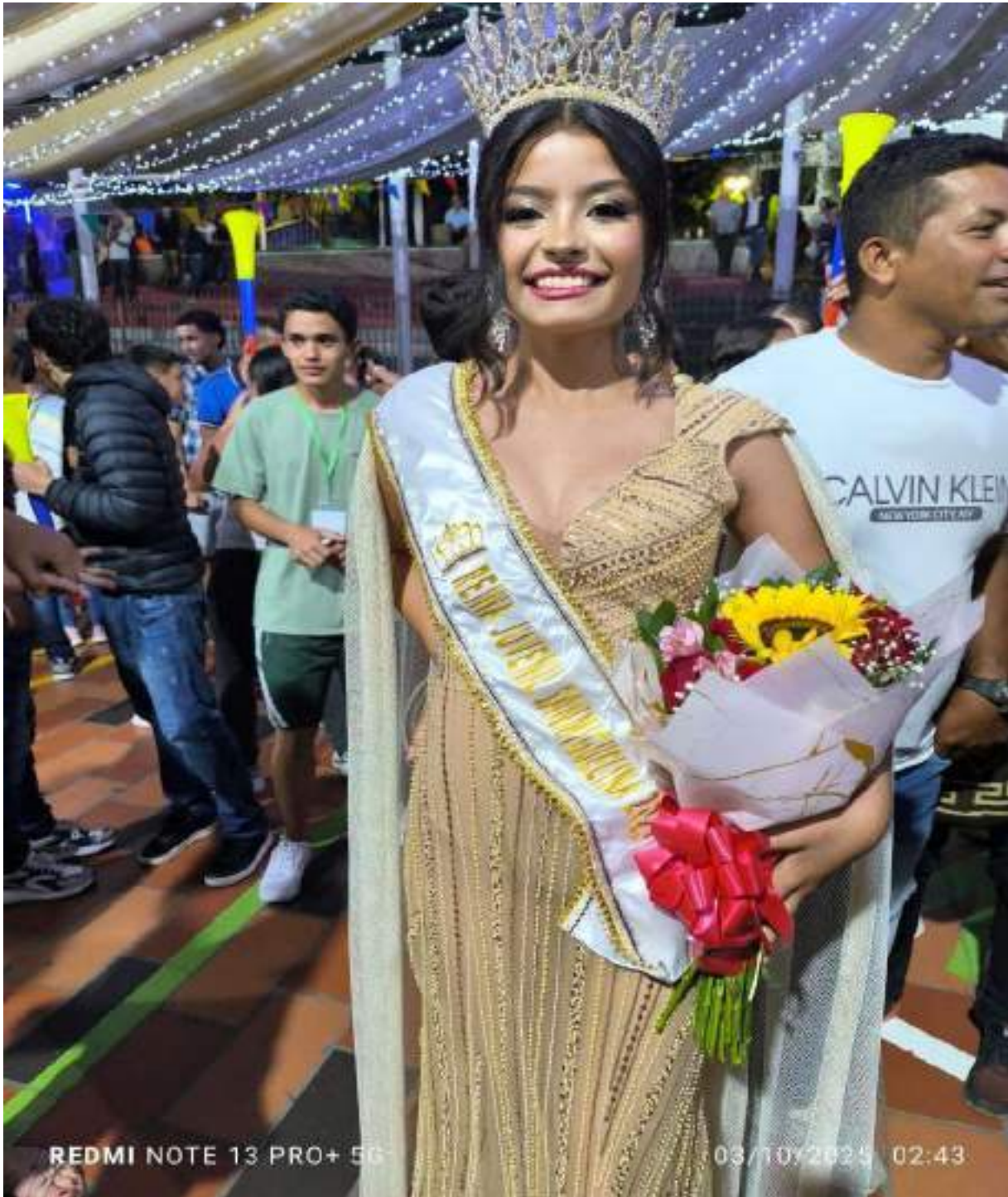
Figura 3. Participación Semana Cultural San Miguelina municipio de Hacarí