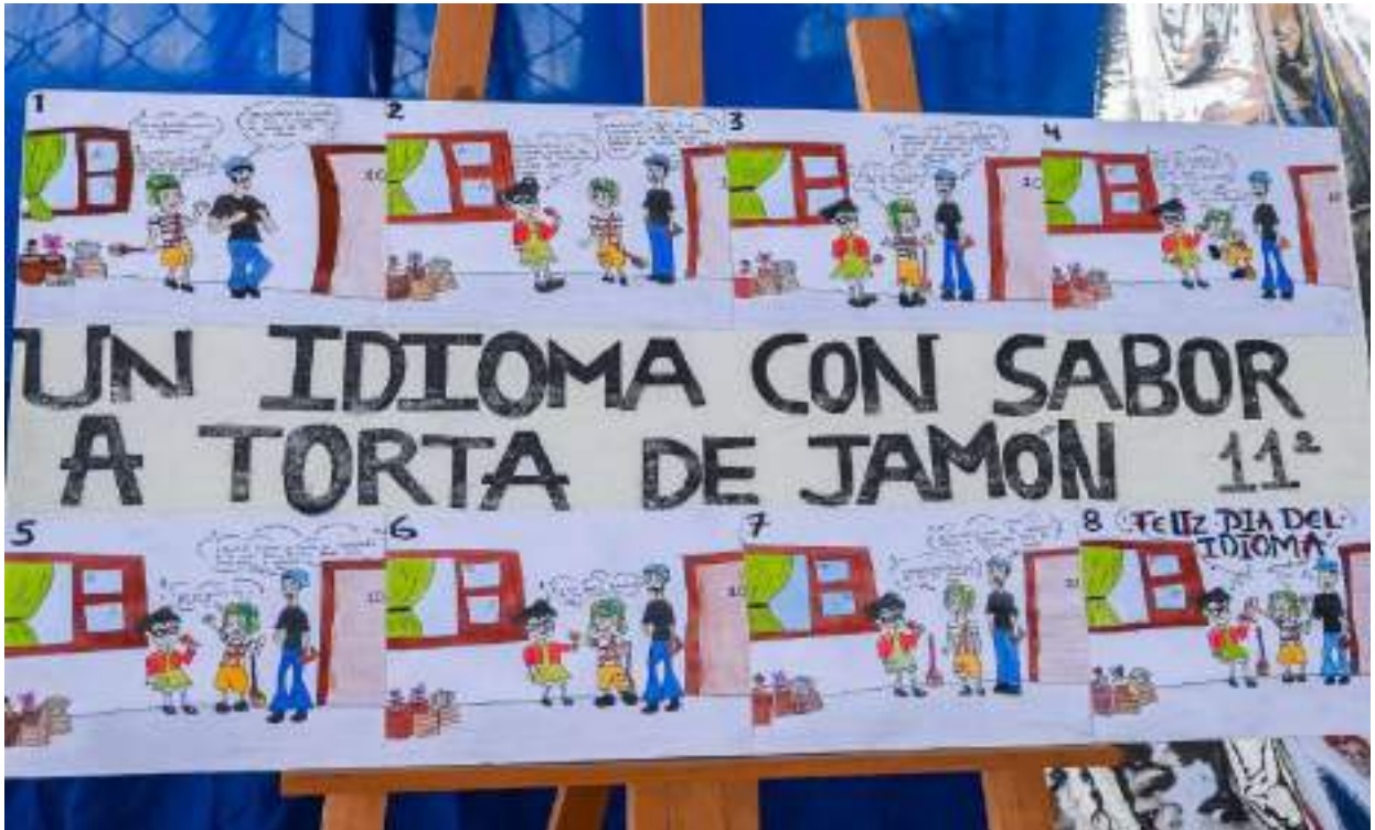
Figura 9. Conmemoración Día del Idioma