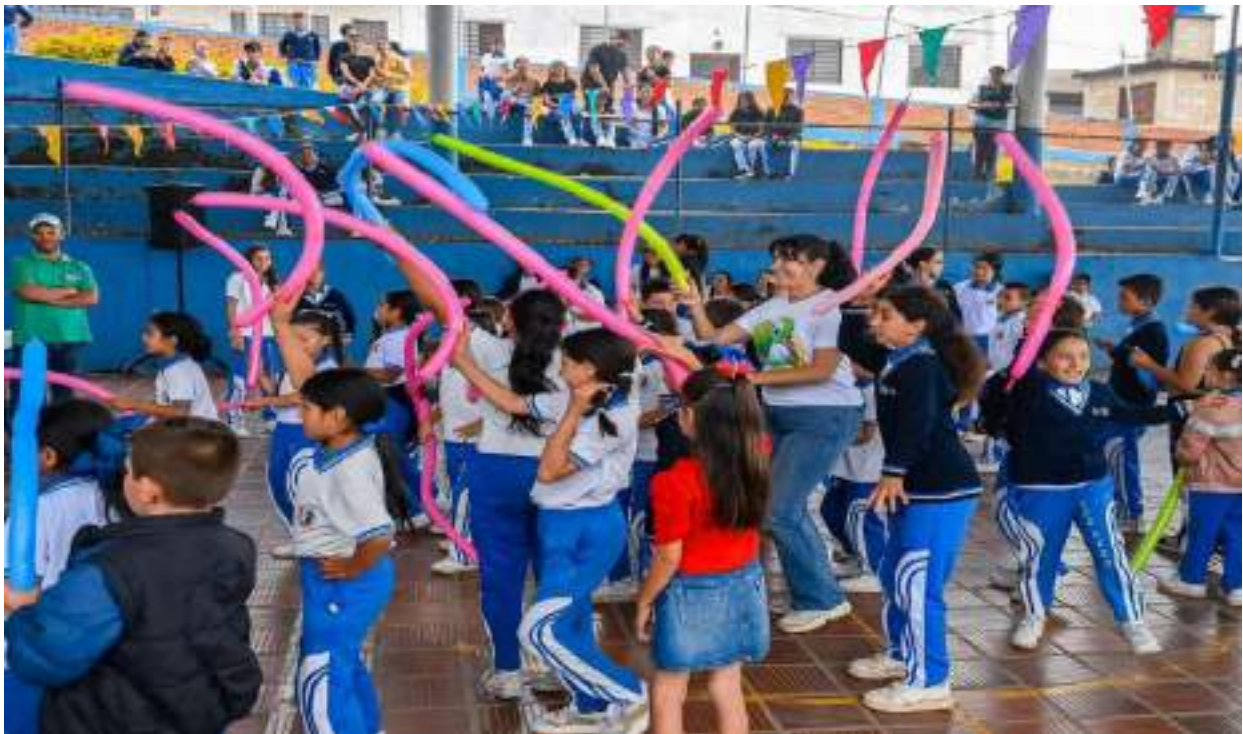
Figura 7. Carnaval de juegos Brújula 2025