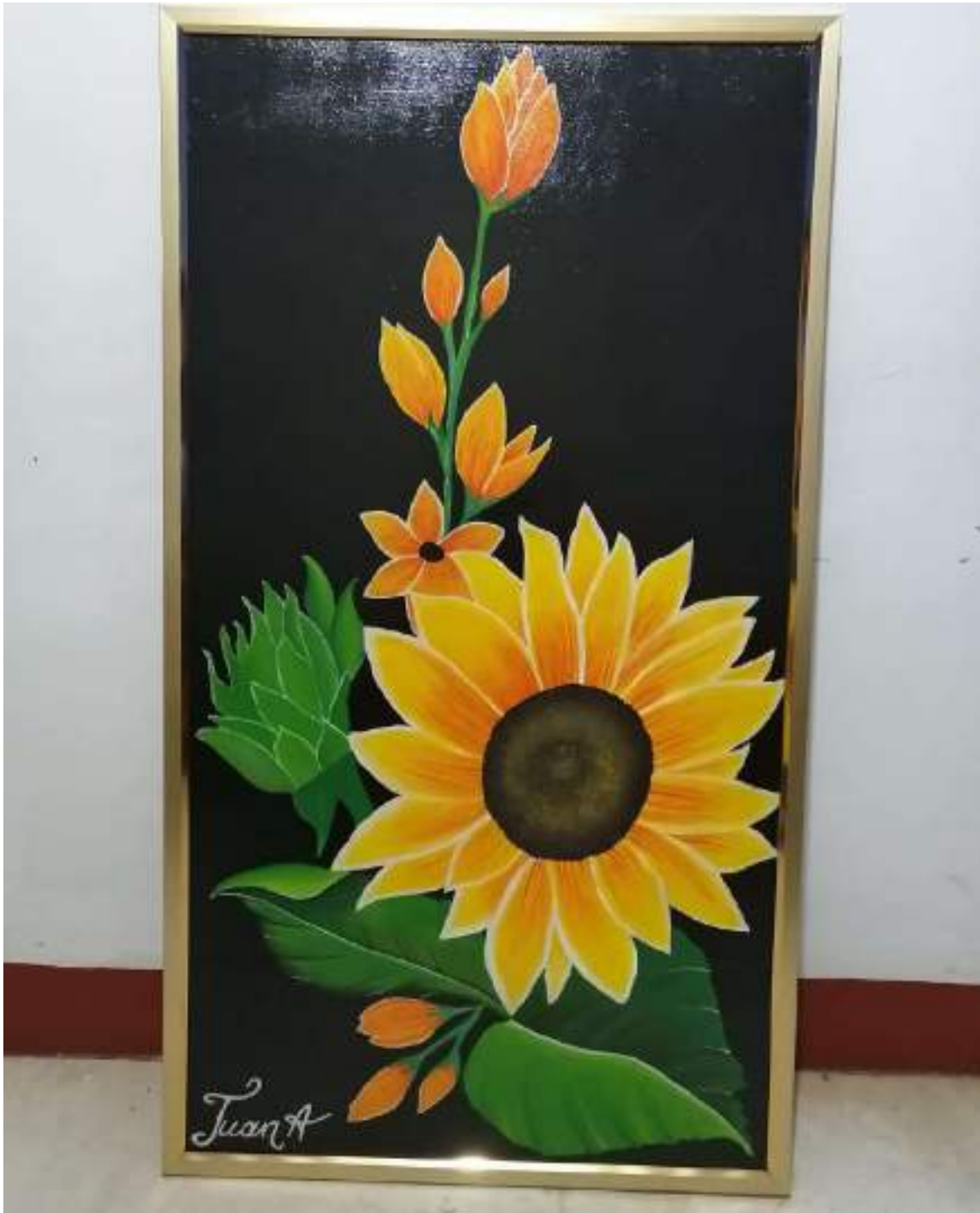
Figura 2. Muestras artísticas elaboradas por estudiantes.