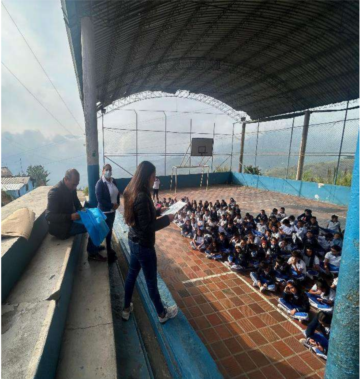
Figura 1. Divulgación del proyecto a toda la comunidad educativa

Actividades ambientales, jornadas de embellecimiento y campañas ecológicas.