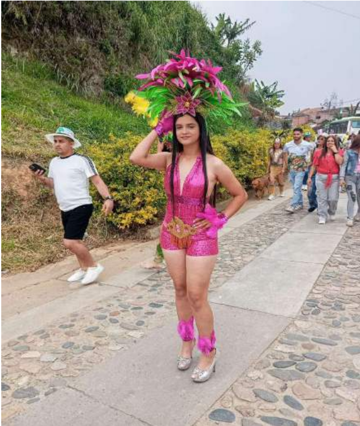
Figura 1. Participación comunidad educativa Fiestas patronales de Aspasica