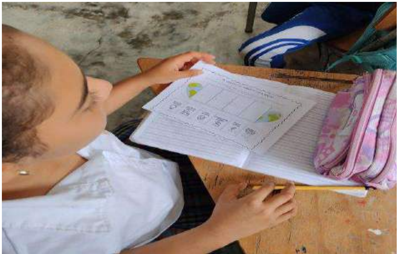
Figura 6. Celebración Día de la Tierra