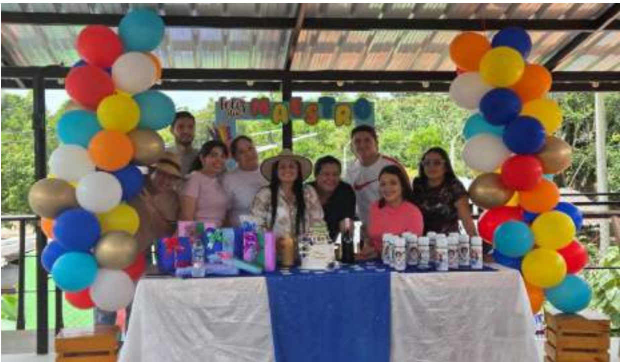
Figura 13. Celebración Día del Profesor