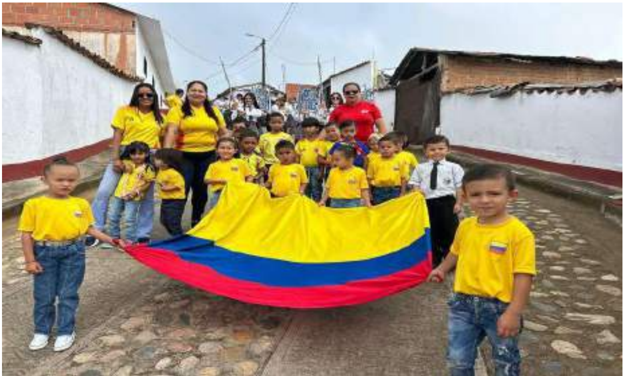
Figura 3. Conmemoración Gesta Independentista (07 de agosto)