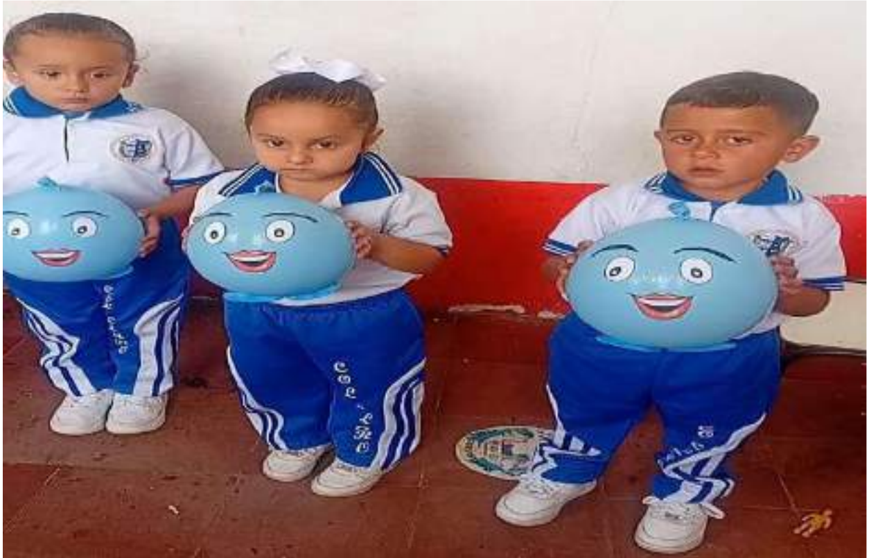
Figura 4. Celebración Día del Agua