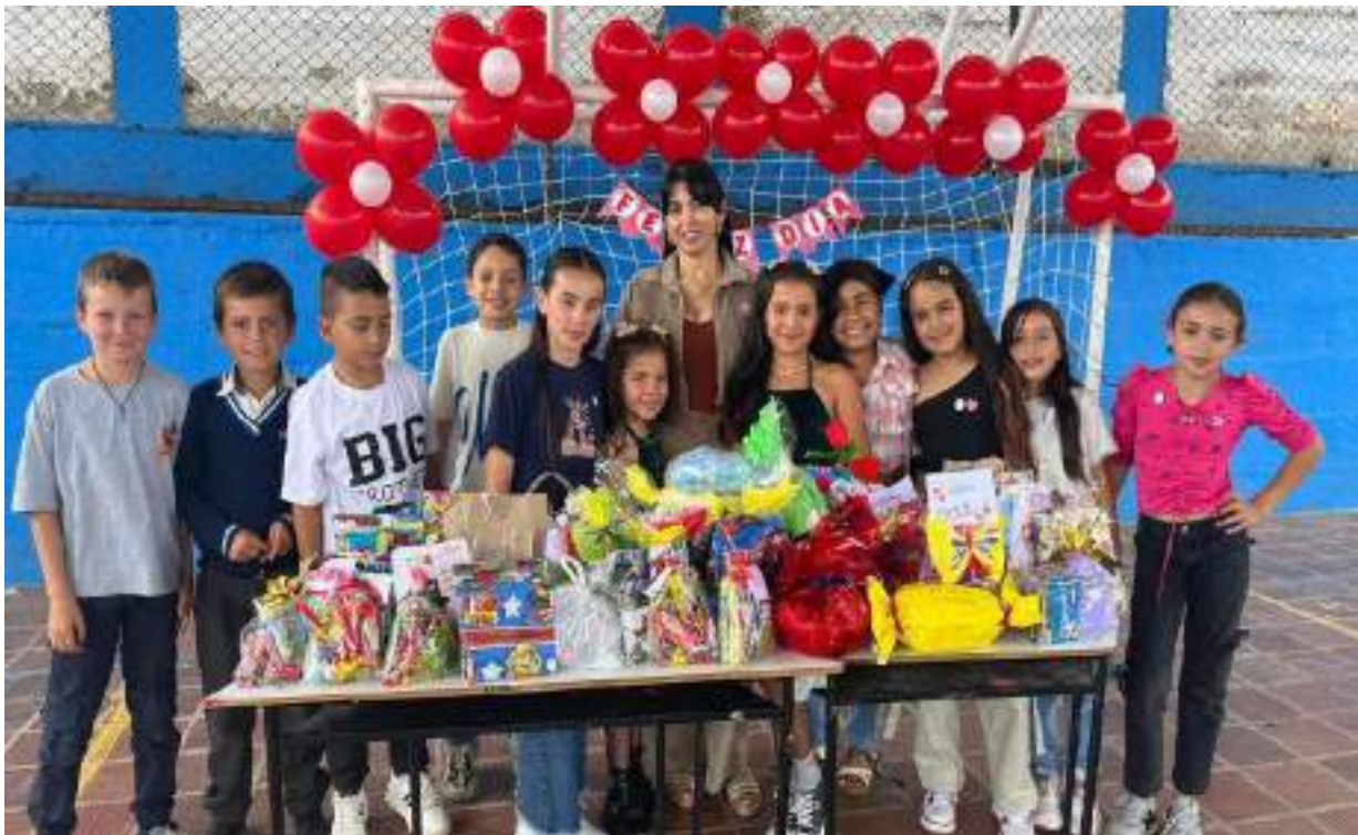
Figura 11. Celebración Día del Amor y la Amistad