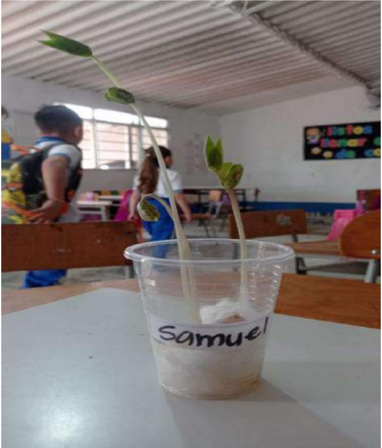
Figura 9. Celebración Día del Medio Ambiente