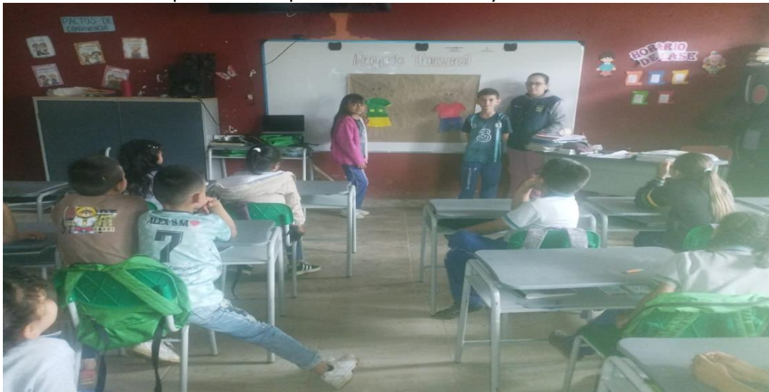
Imagen: 006 En la imagen se observa a una niña participando activamente en la actividad pedagógica, identificando las partes del cuerpo en las siluetas del niño y la niña.