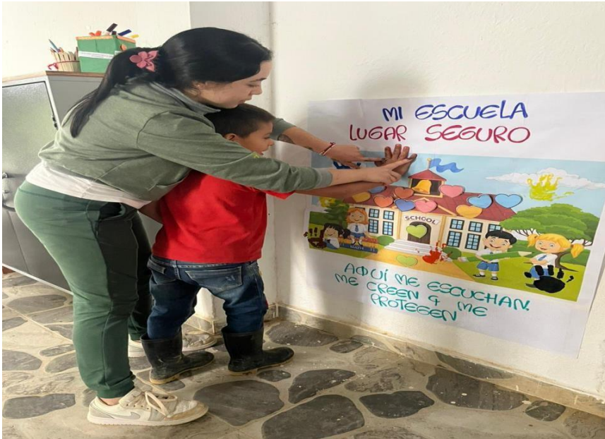
Imagen: 001 En esta imagen se observa a la docente orientando a los estudiantes en la actividad “Mi escuela, lugar seguro”.