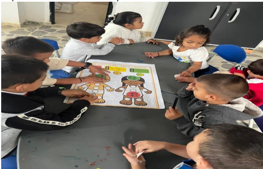
Imagen: 002 En la imagen se observa a los niños y niñas participando activamente en la actividad pedagógica en la que observan las siluetas del niño y la niña.