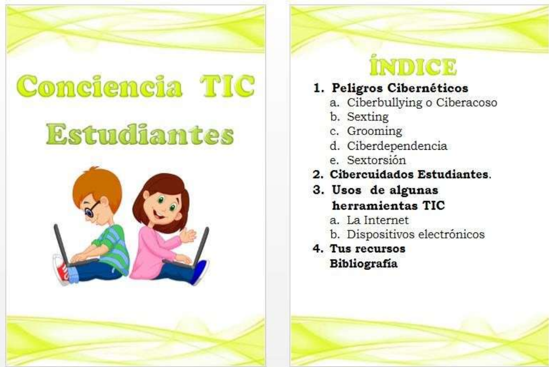
Ilustración 2 Cartilla Conciencia TIC Estudiantes