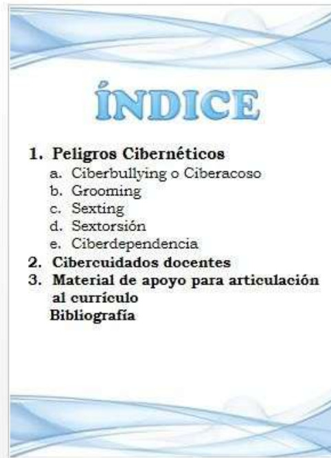
Ilustración 3 Cartilla Conciencia TIC Docentes