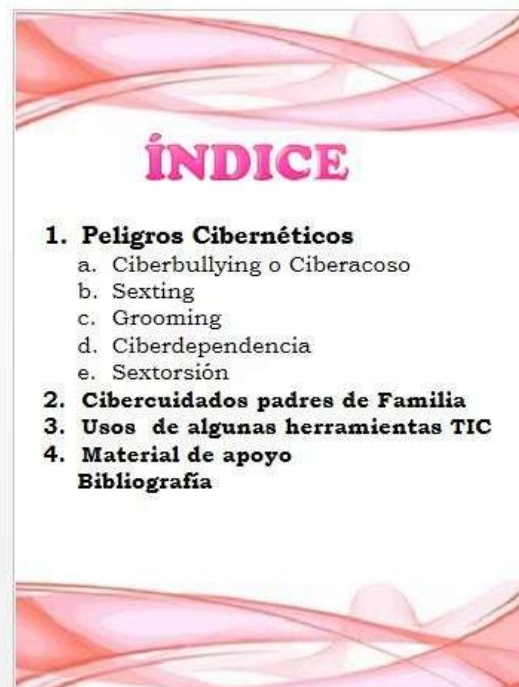
Ilustración 4 Cartilla Conciencia TIC Padres de Familia.