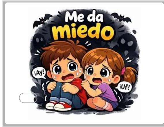
☹️ Me da miedo