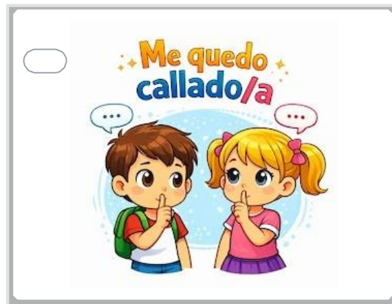
☺ Me quedo callado/a