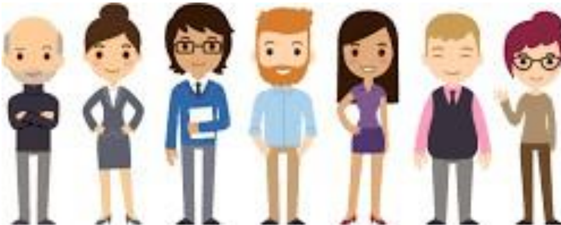
Figura 2 Directivos