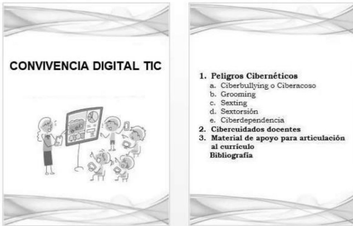
Ilustración 3 cartilla con vivencial digital TIC docentes

Esta cartilla provee a los docentes herramientas que le permitirán tener una mejor preparación en temas de tanta relevancia para los estudiantes como lo son los peligros cibernéticos, cibercuidados, además de material de apoyo para la articulación de las herramientas TIC a currículo, con lo que se busca fortalecer el proceso de enseñanza aprendizaje. Se anexa la cartilla Convivencia Digital TIC Docentes.