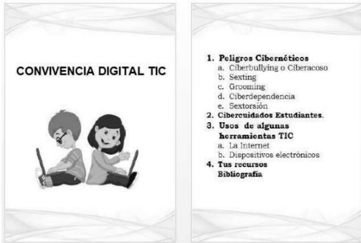
Ilustración 2 cartilla convivencia digital TIC estudiantes

Esta cartilla proporciona a los estudiantes una variedad de temáticas que le permitirán tener conocimiento de los peligros cibernéticos a que se exponen si no realizan un uso adecuado de internet, además proporciona una serie de ciber cuidados que le permitirá: estar mejor preparados para enfrentar dichos peligros, así mismo se presentan los usos que pueden dársele a algunas herramientas TIC y por último unas series de enlaces a recursos disponible en la red para que puedan profundizar sus conocimientos. Se anexa la cartilla Convivencia Digital TIC Estudiantes.