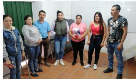
consejo de padres