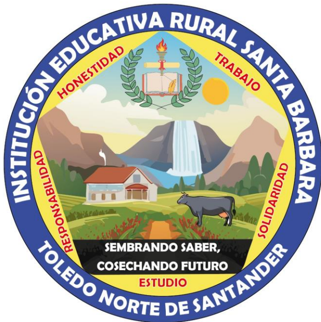
Imagen 2 Escudo