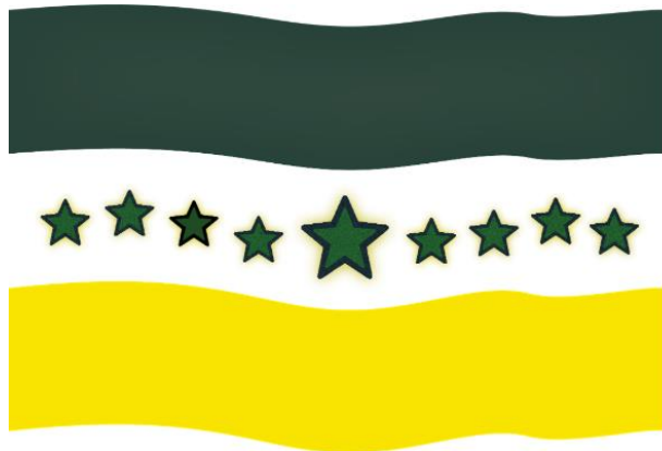
Imagen 1: La Bandera