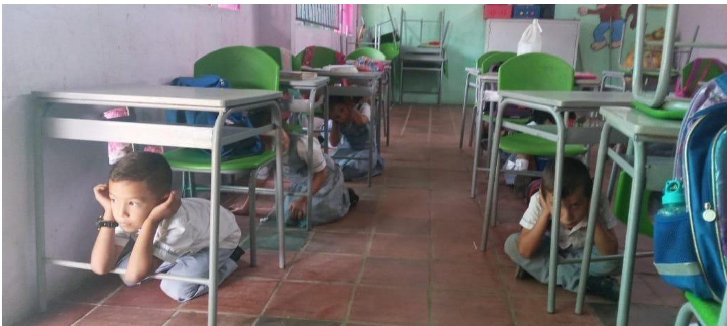
SIMULACRO HOSTIGAMIENTO DE GRUPOS ARMADOS