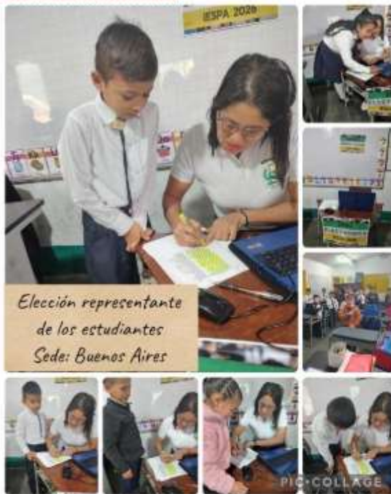
Elección representante de los estudiantes Sede: Buenos Aires

“Esfuerzo, Compromiso y Liderazgo” ÁREA DE GESTIÓN ACADÉMICA PROYECTOS TRANSVERSALES