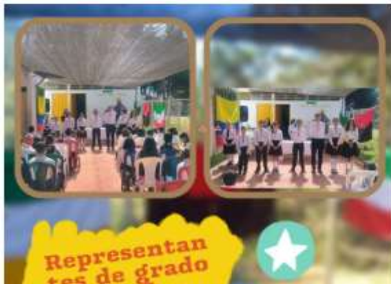
Representantes de grado