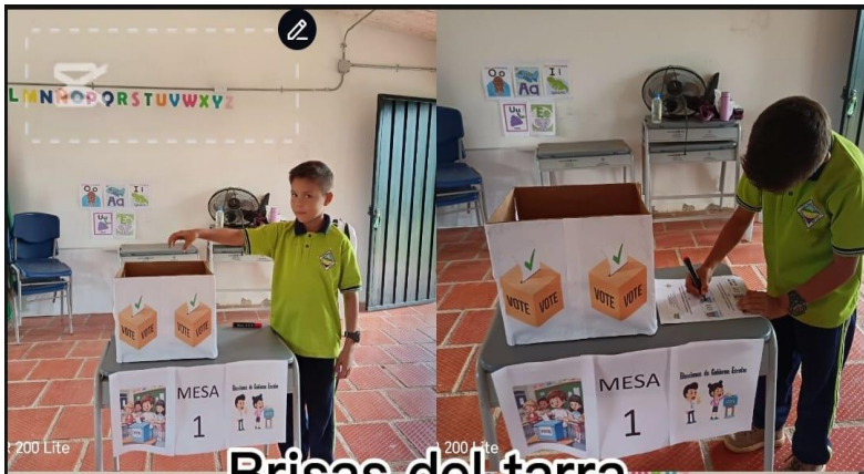
Brisas del tarra