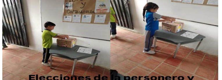
Elecciones de la personero y contralor estudiantil