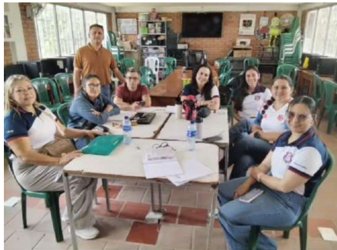
REUNIÓN "EGEM" EQUIPO GESTOR DE EDUCACIÓN MEDIA

"Por La Excelencia Educativa, Seguimos Creciendo"