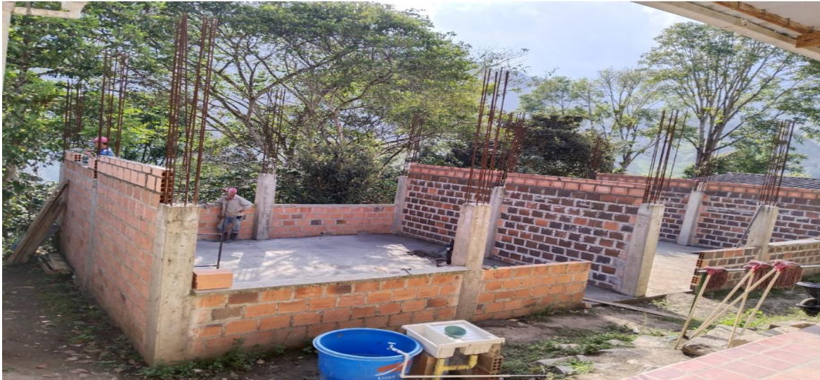
CONSTRUCCION DE LA PLACA

RETOMA DE LA OBRA SEGUNDA ETAPA: INICIO DE OBRA 2 DE FEBRERO DE 2024