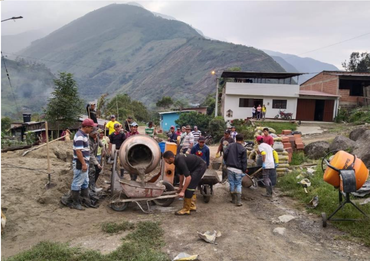
ARREGLO DEL ENCERRAMIENTO DE LA SEDE