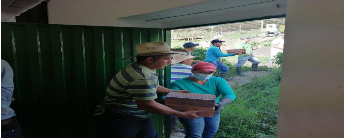
DESCARGUE DE MATERIALES