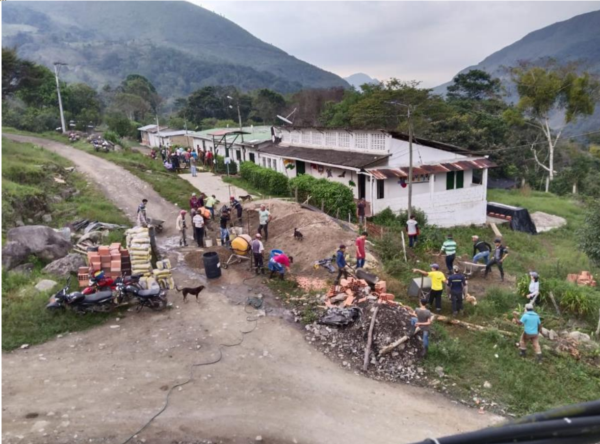
FINALIZACION PLACA PARA EL SEGUNDO PISO