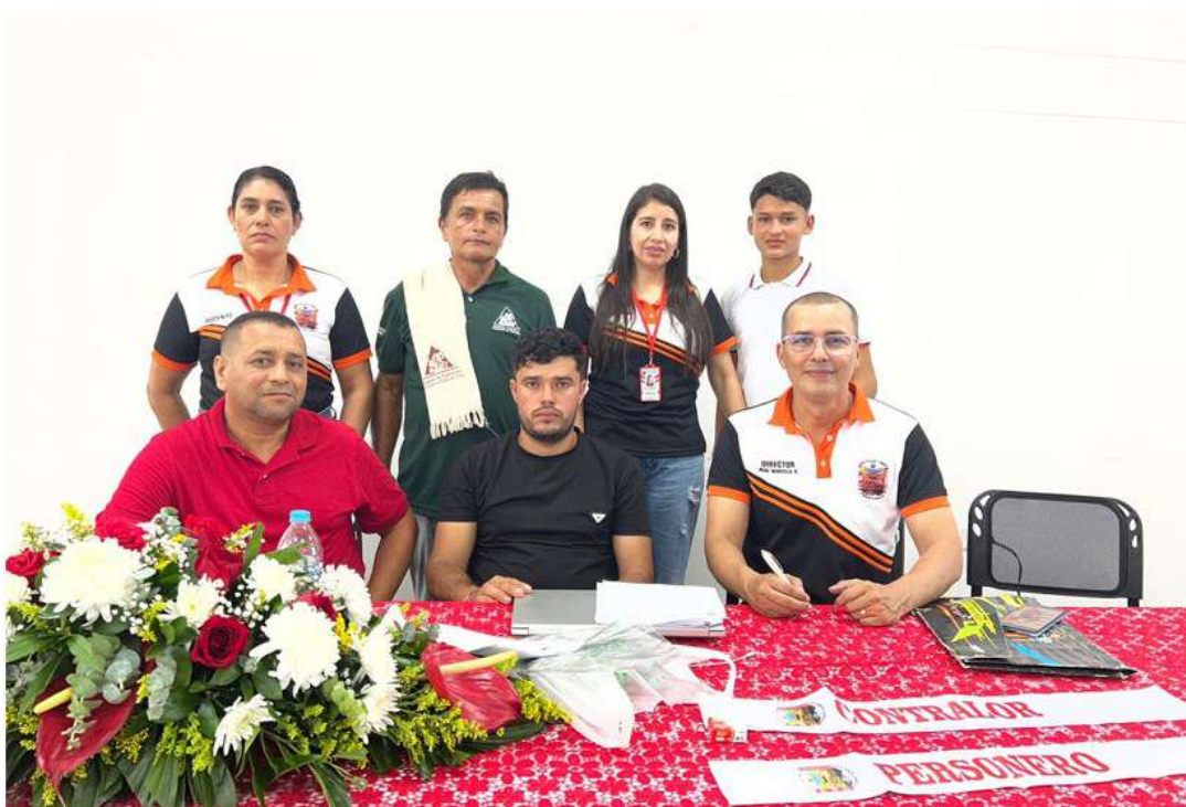
Consejo directivo CER PLAYAS LINDAS 2026