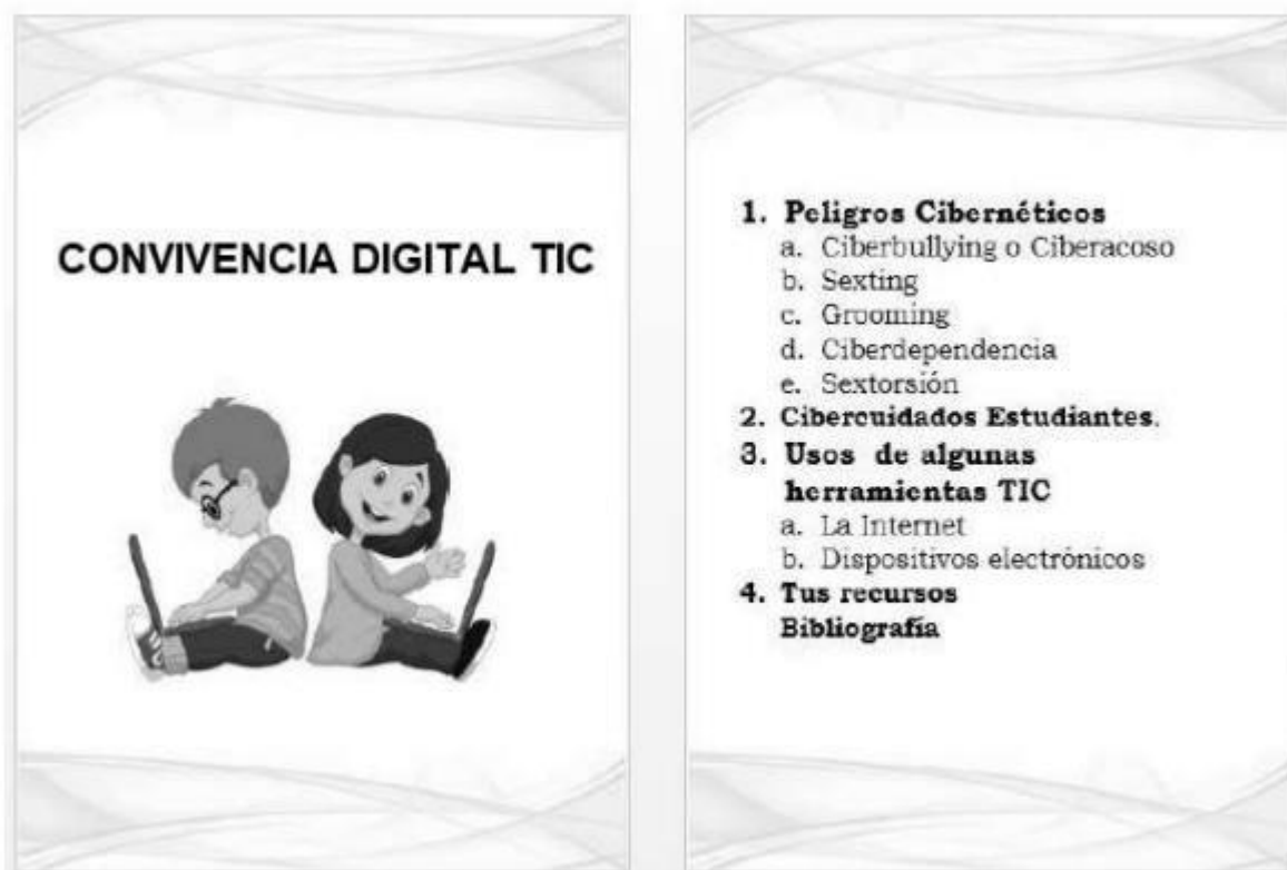
Ilustración 2 cartilla convivencia digital TIC estudiantes

Esta cartilla proporciona a los estudiantes una variedad de temáticas que le permitirán tener conocimiento de los peligros cibernéticos a que se exponen si no realizan un uso adecuado de internet, además proporciona una serie de ciber cuidados que le permitirá: estar mejor preparados para enfrentar dichos peligros, así mismo se presentan los usos que pueden dársele a algunas herramientas TIC y por último unas series de enlaces a recursos disponible en la red para que puedan profundizar sus conocimientos. Se anexa la cartilla Convivencia Digital TIC Estudiantes.