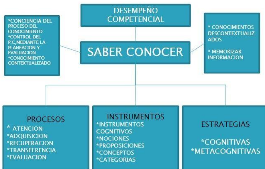
Figura 4 Saber conocer

La valoración integral comprende dos aspectos fundamentales: el desempeño académico en los procesos curriculares, extracurriculares, transversales y productivos y el desarrollo de las competencias ciudadanas, las actitudes y los valores, dentro de un clima pacífico de sana convivencia y de tolerancia.