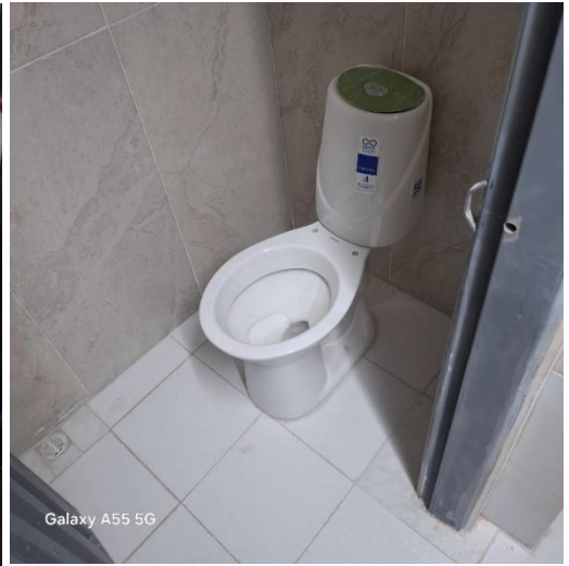
Galaxy A55 5G