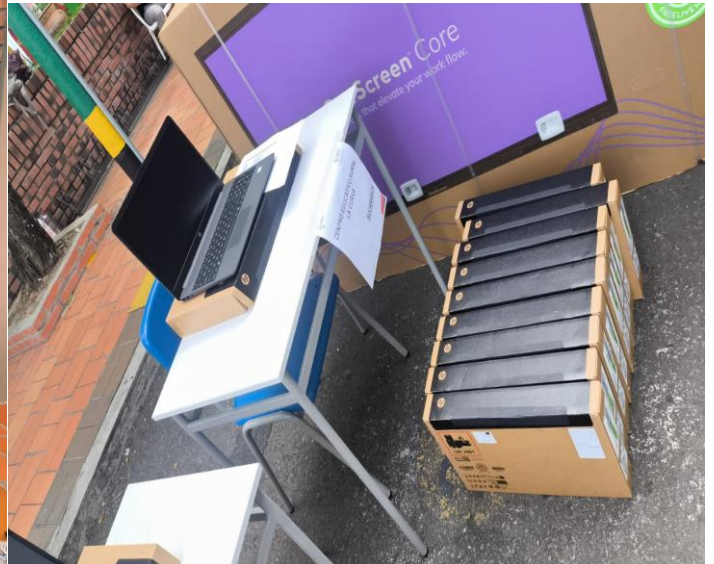
MAS HERRAMIENTAS TIC