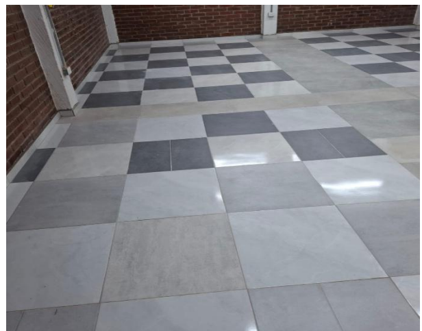
AULA SEDE PRINCIPAL