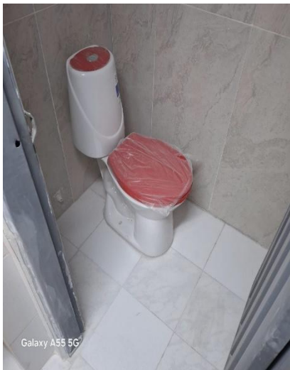
Galaxy A55 5G