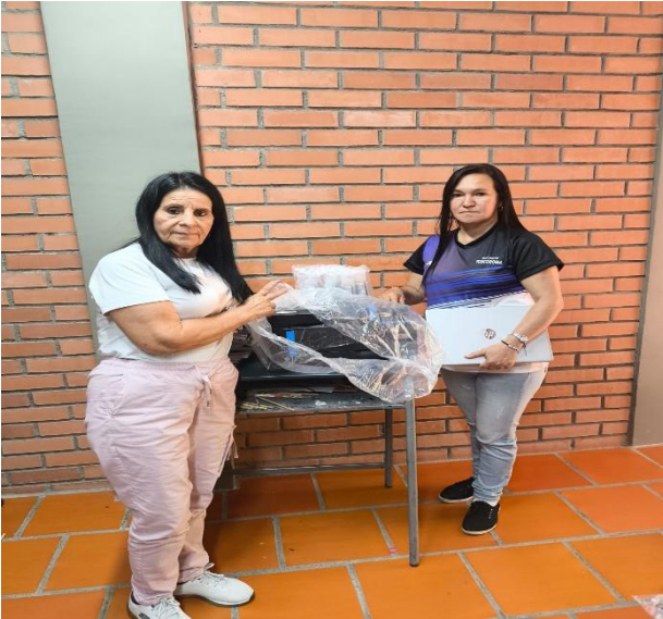
SEDE LA LAGUNA