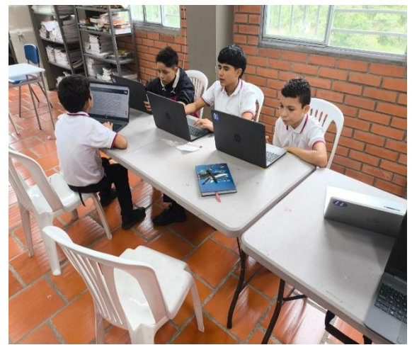
HERRAMIENTAS TECNOLOGICAS PARA LAS SEDES