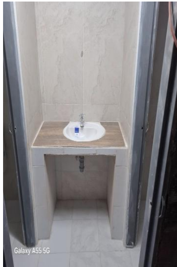
Galaxy A55 5G