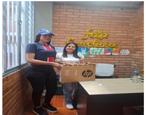
SEDE EL SILENCIO