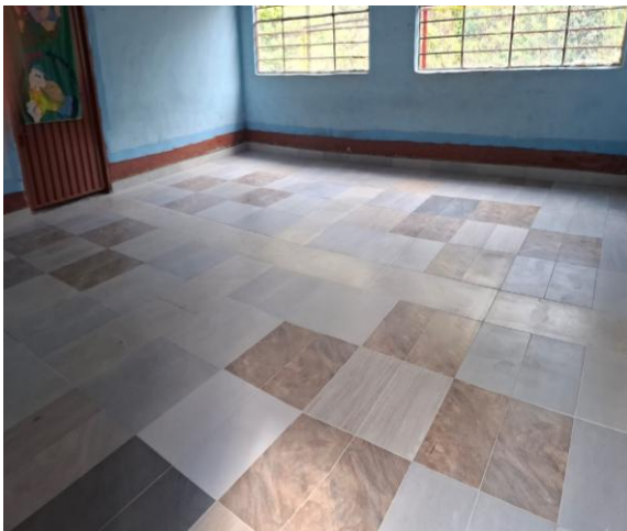
AULA SEDE LAS INDIAS