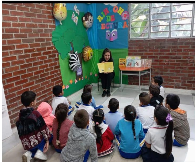
PROYECTO FORMACION INTEGRAL: CONECTANDO SABERES