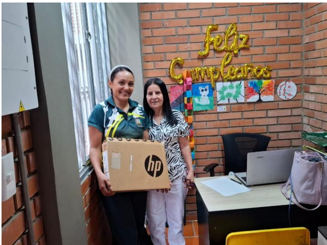
SEDE EL ESPEJO