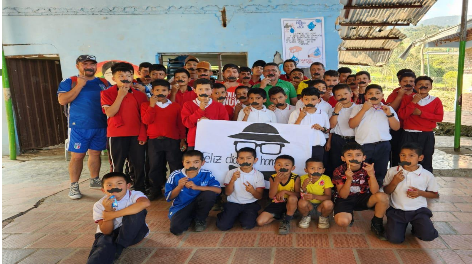
CELEBRACION DIA DEL HOMBRE