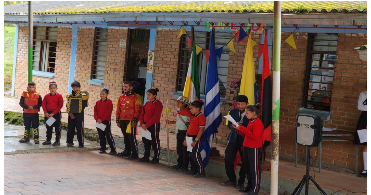
IZADAS DE BANDERA