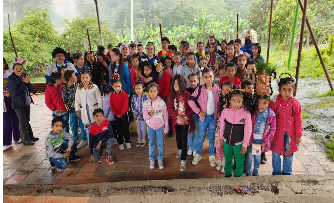
DIA DE PEINADOS LOCOS