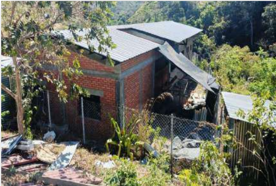
SEDE LAS DELICIAS