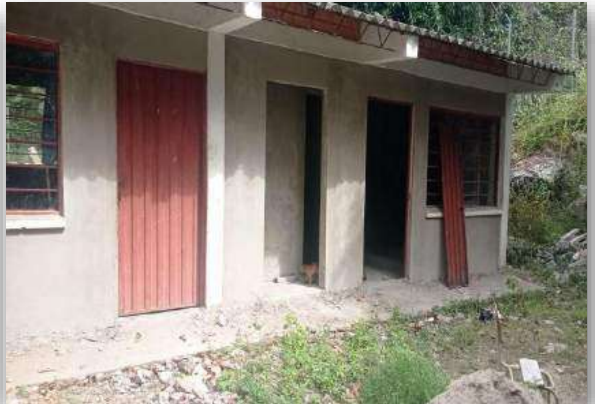
SEDE LA ESPERANZA