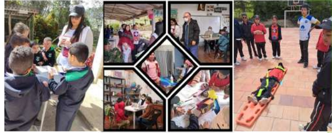
Jornadas de trabajo