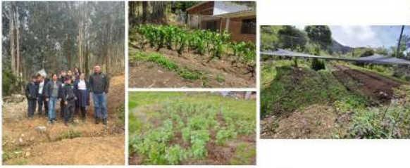
Centros de interés

Fiestas patronales Escuela de padres Día de la familia