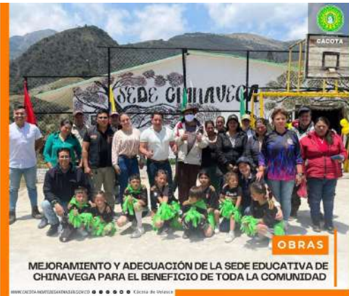
OBRAS MEJORAMIENTO Y ADECUACIÓN DE LA SEDE EDUCATIVA DE CHINAVEGA PARA EL BENEFICIO DE TODA LA COMUNIDAD