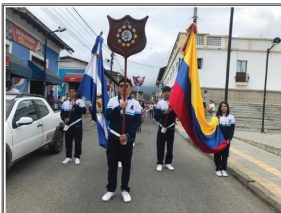
Inauguración de los Juegos Inter clases del Colegio la Presentación 2025 abril 10