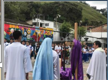
Viacrucis del colegio la Presentación abril 04