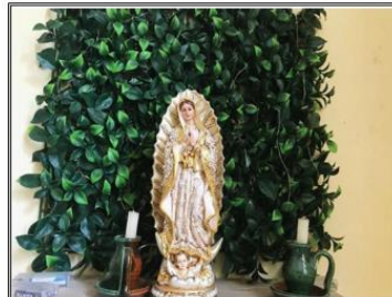
Mes Mariano altares a la Virgen Mayo