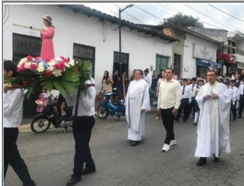
EUCARISTIA DE PRIMERAS COMUNIONES Y DIA PATRONAL DEL COLEGIO NUESTRA SEÑORA DE LA PRESENTACION Noviembre 21