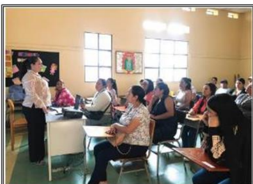
3:30 p.m. a 5:00 p.m. Reunión de padres de familia sede principal con sus titulares Socialización SIE, Manual de convivencia y Orientaciones institucionales Elección Padres representantes Febrero 06