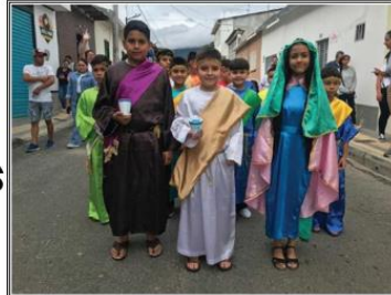
Ofrenda mariana Sede Centro Mayo 28