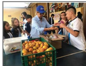
Entrega del P.A.E estudiantes la Presentación abril 10