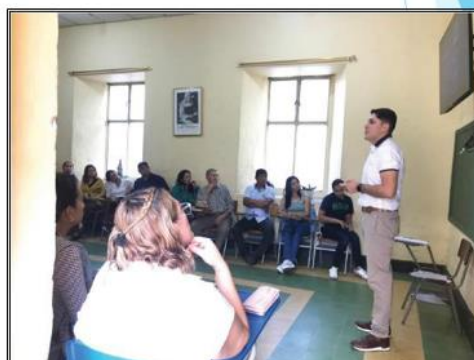
3:30 p.m. a 5:00 p.m. Reunión de padres de familia sede principal con sus titulares Socialización SIE, Manual de convivencia y Orientaciones institucionales Elección Padres representantes Febrero 06