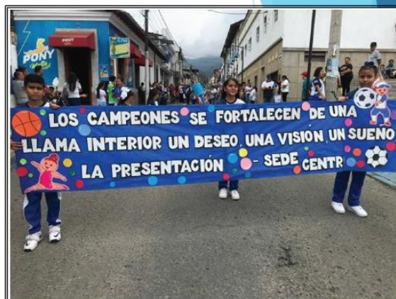
Inauguración de los Juegos Inter clases del Colegio la Presentación 2025 abril 10