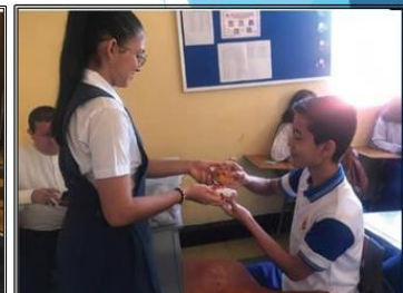
Retorno del PAE Junio 2