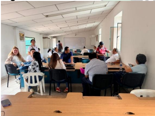
Figura 4. Trabajo del equipo docente