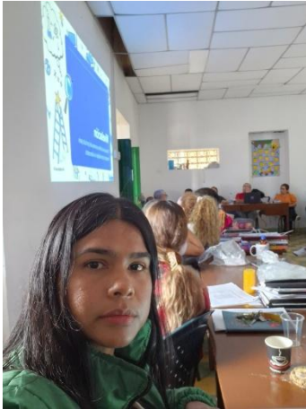
Figura 2. Socialización de documentos institucionales con estudiantes.