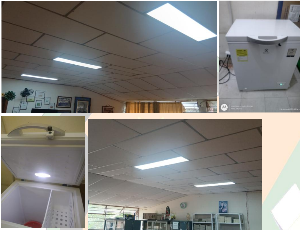
Figura 7. Gratuidad- RG-RBG. SEDE ÁLAMOS