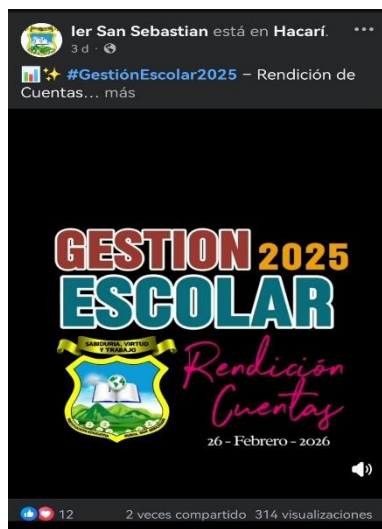
Ilustración 2, Socialización de la rendición de cuentas