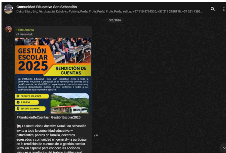
Ilustración 5, publicación en grupos de WhatsApp la invitación a la rendición de cuentas