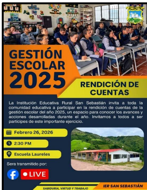
Ilustración 4, Flyer de invitación a rendición de cuentas 2025