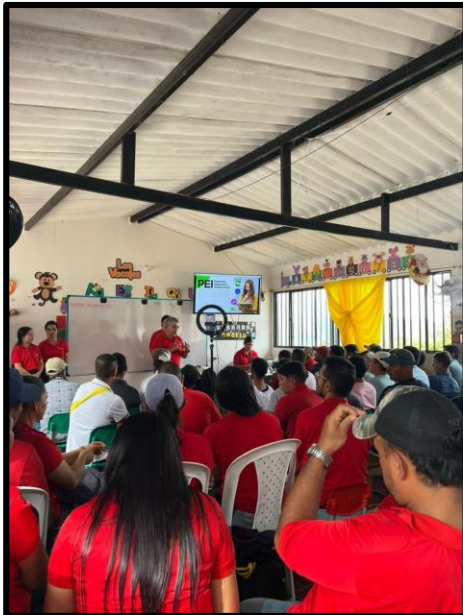
Ilustración 3, información presentada, previamente recolectada