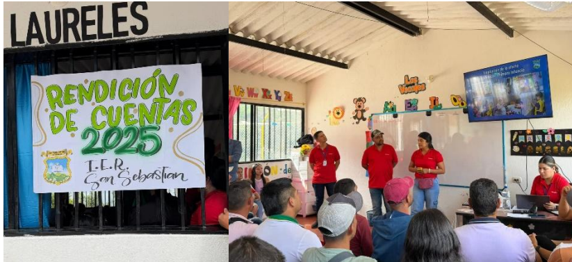
Ilustración 6, Ejecución de la rendición de cuentas