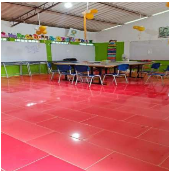
(cerámica en la sede Puente Piedra)

En el año 2025, la sede Pablo VI. Puente Piedra, Las Mesas, Fosfonorte, la Rugosa y la Pailona fueron beneficiadas con la donación de tableta para piso por la empresa Cerámica Italia. Gracias a esa donación se mejoró el ambiente escolar, quedando las sedes en mejor estado físico, los niños pueden disfrutar en la jornada escolar y en el tiempo libre, realizando actividades sentados en el piso, manifiestan que hay mayor comodidad y agrado.