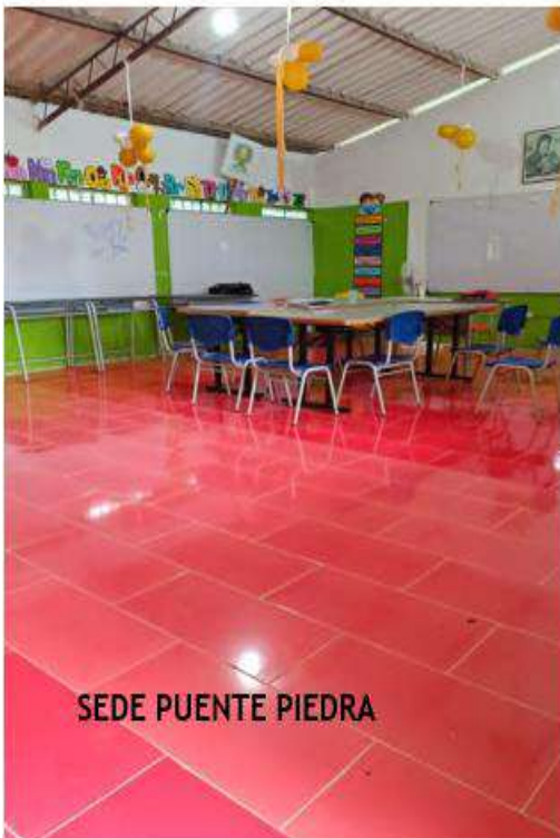
SEDE PUENTE PIEDRA