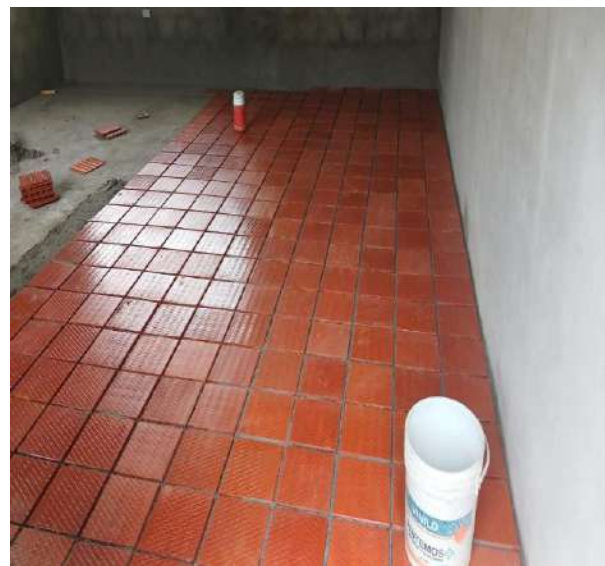
sede Pablo Sexto