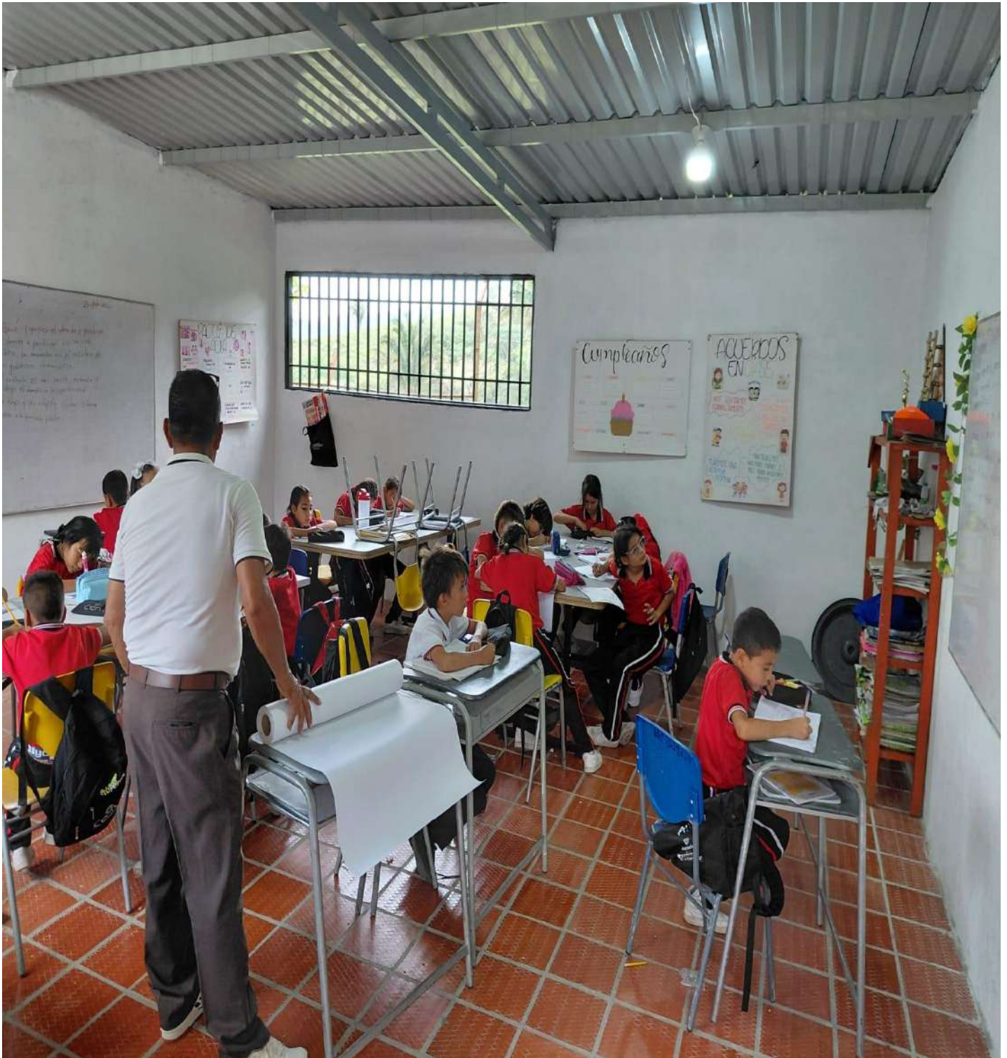
Aula construida con aportes comunitarios y Alcaldía Municipal de Sardinata.