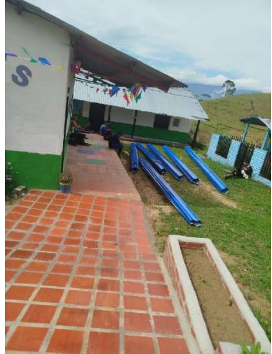
Sede Pailona: Mantenimiento de la sede y remodelación de pisos.