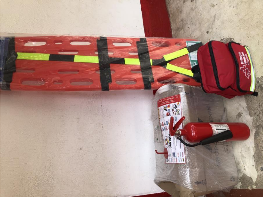
Donación recibida de Opción Legal