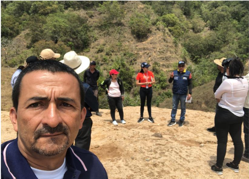
Visita de predios para la reubicación de la sede principal