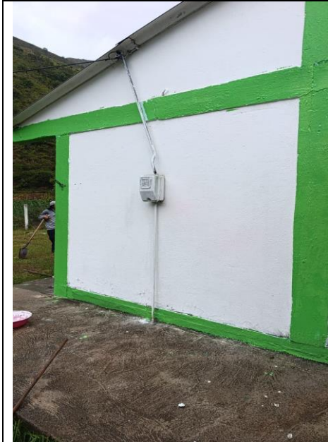
SEDE LA URAMA ANTES