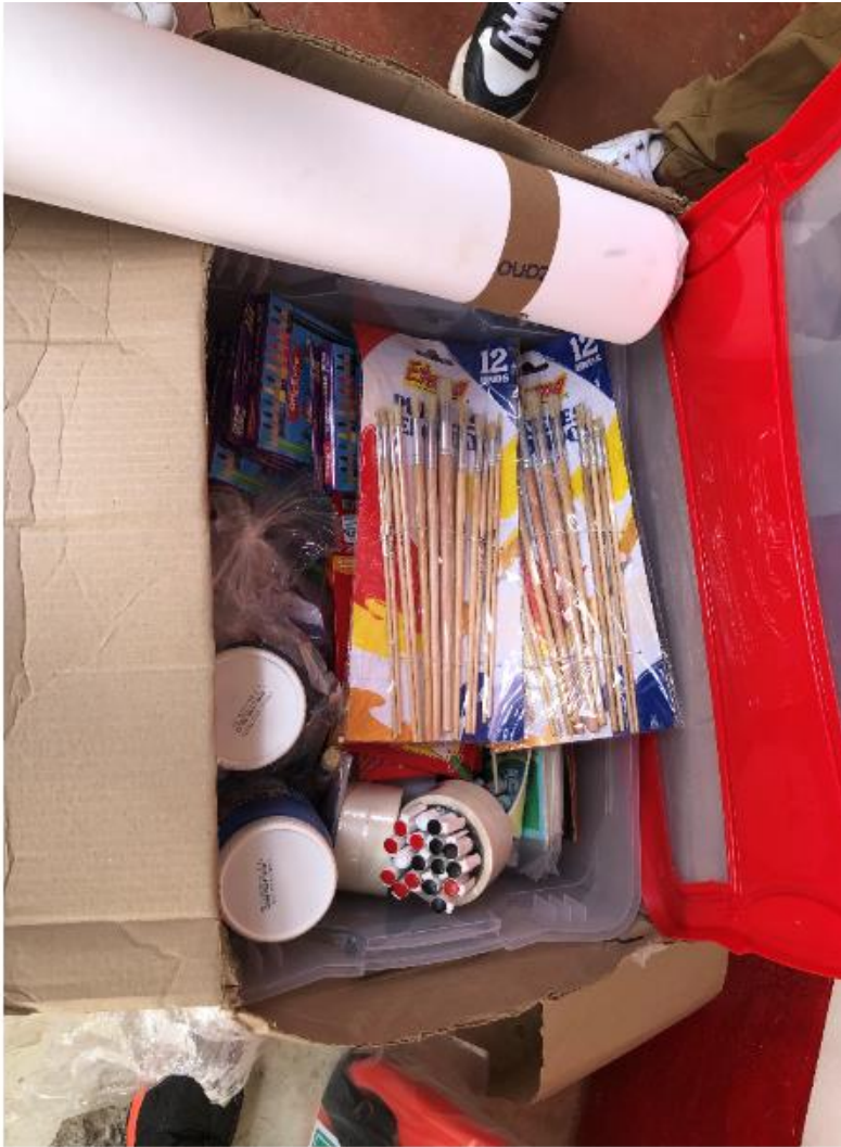
Dotación recibida de Opción legal