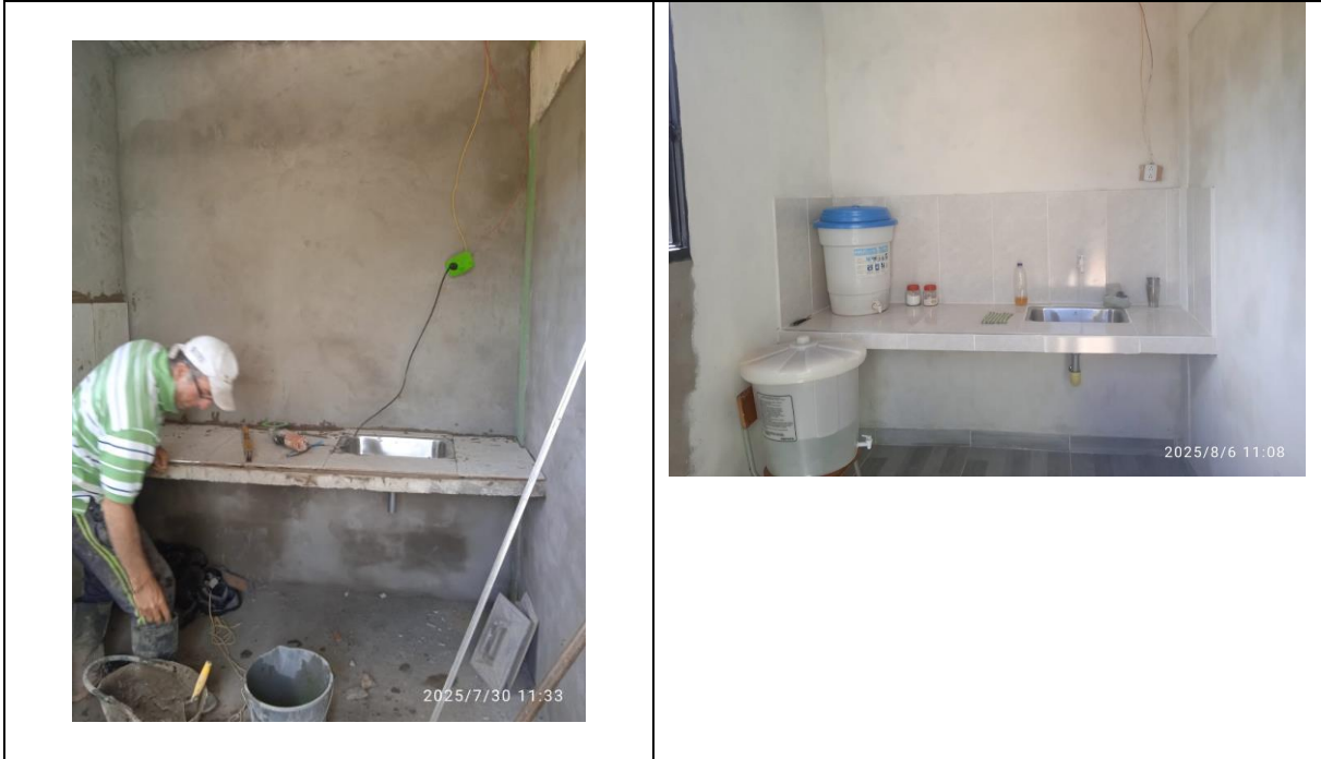
QUEBRADA DE PARAMILLO