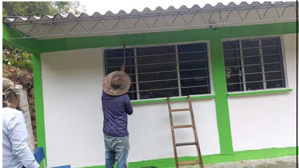
SEDE LA URAMA DESPUES