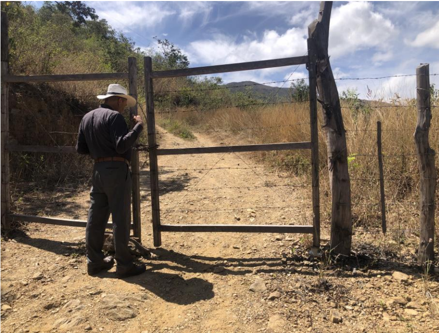
Visitas de terrenos para reubicación sede principal