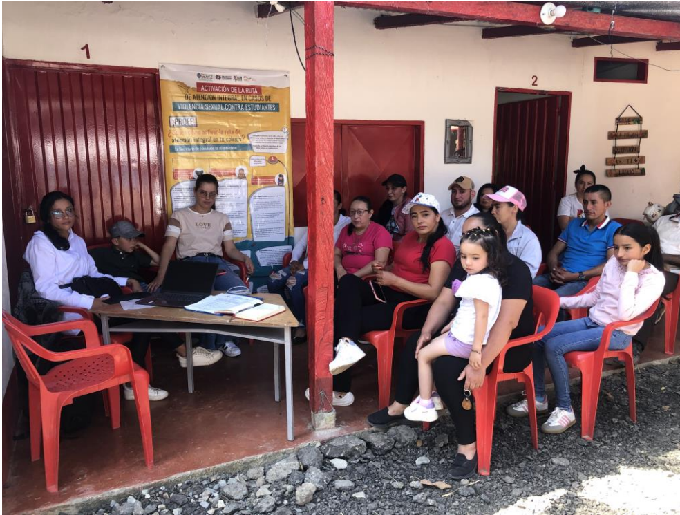
Reunión Consejo de Padres de familia