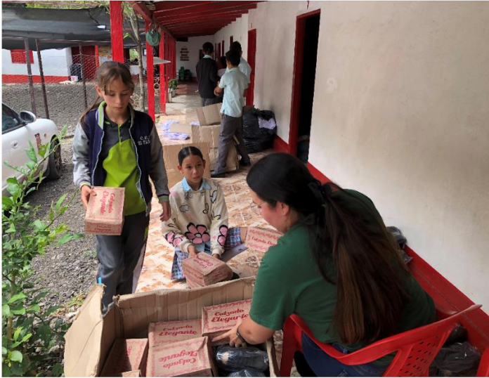
Entrega de uniformes donados por la gobernación de Norte de Santander