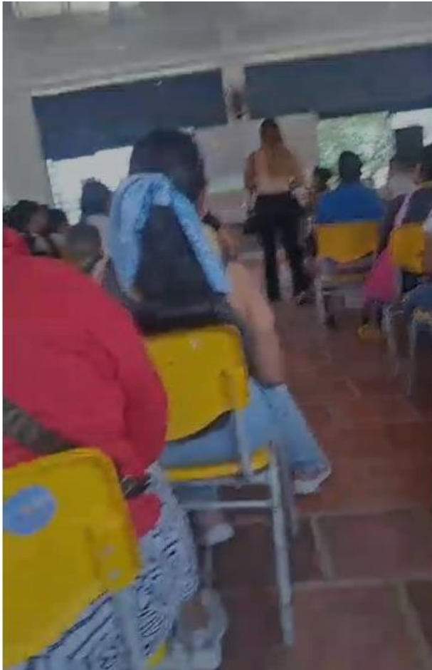
Intervención de la comunidad.

Se informó que el documento general será publicado en la página web institucional y a petición de algunos asistentes se publicará igualmente en el Grupo Institucional de WhatsApp.