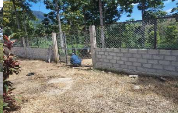
Salón de Ciencia y Tecnología