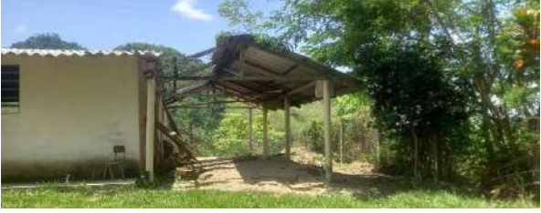
Antes de construir el alar para ciencia y tecnología