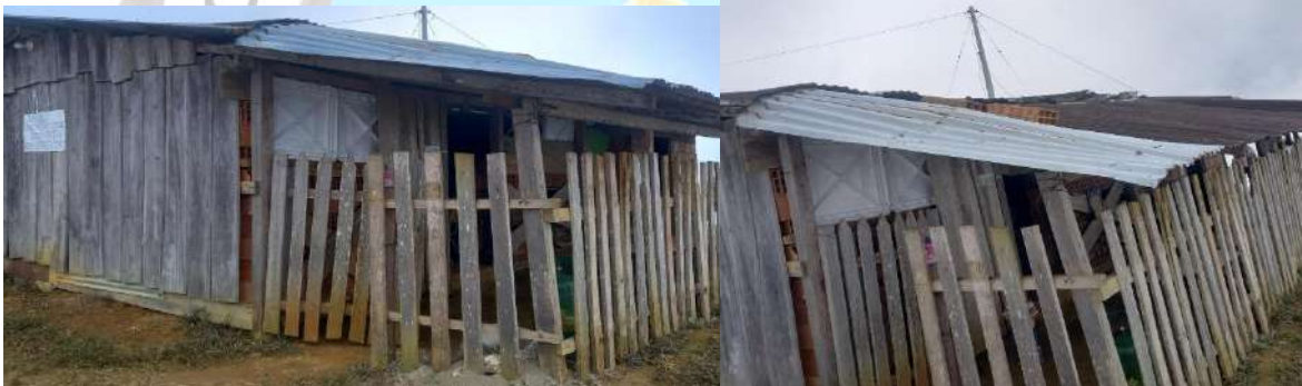
SEDE SAN JUAN BAUTISTA ANTES Y DESPUES