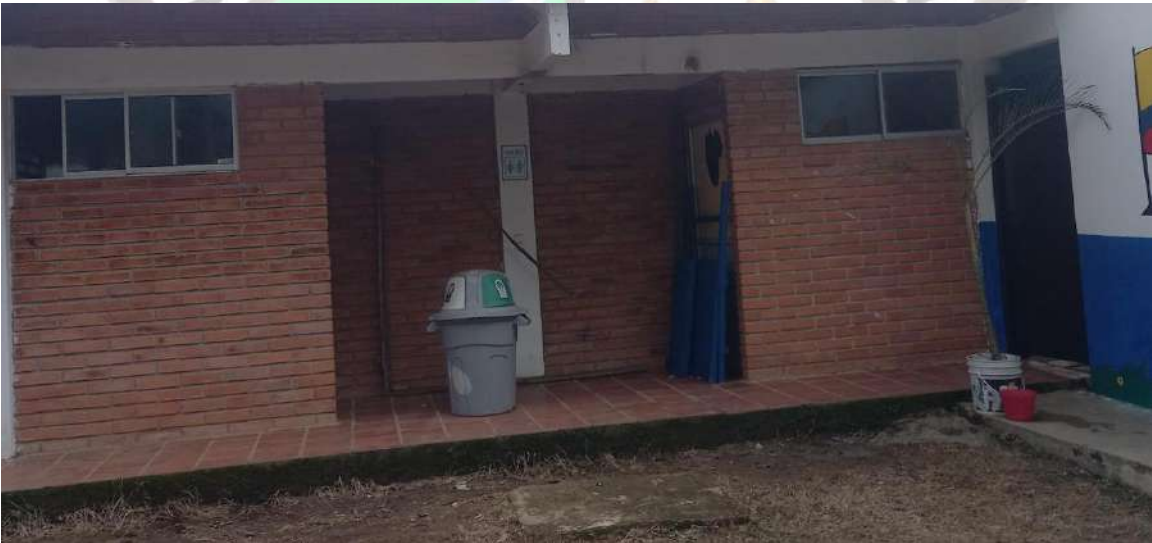
Encerramiento sede principal