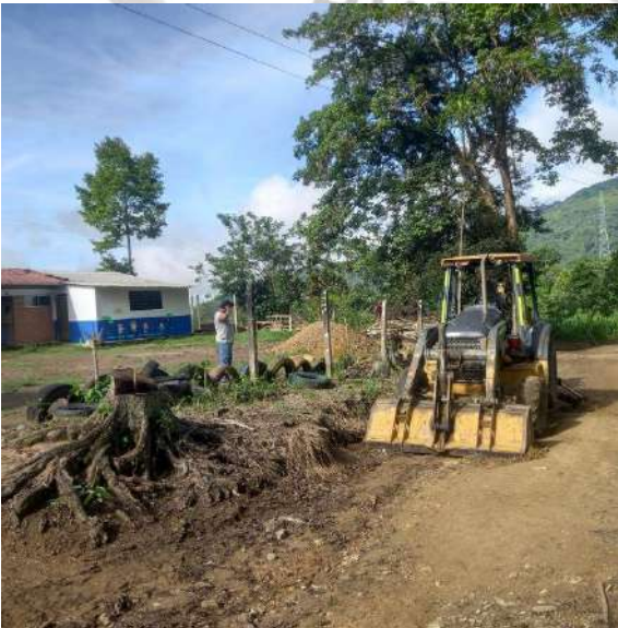
Alar sede principal Área de primaria