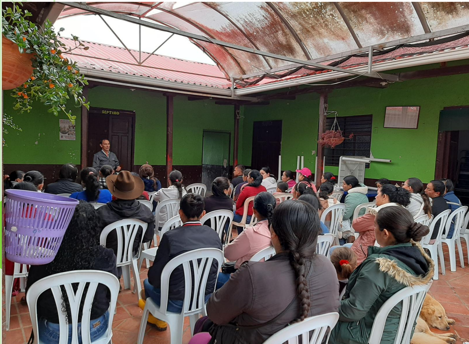
REUNION CON PADRES DE FAMILIA