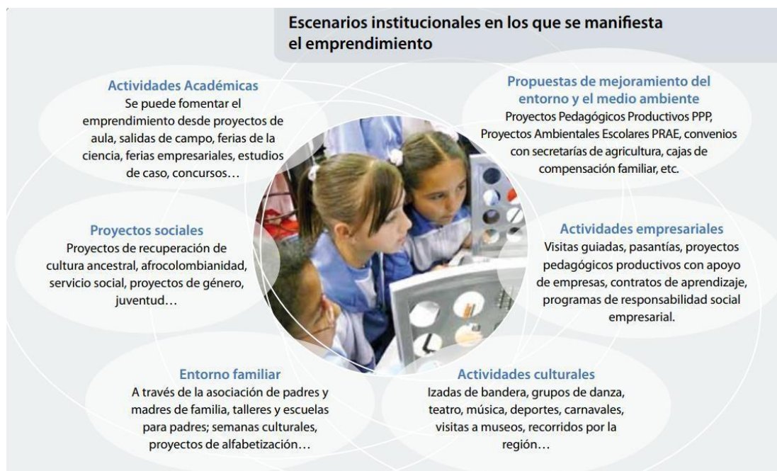
Ilustración 3 Escenarios en los que se manifiesta el Emprendimiento

destinadas a fortalecer y fomentar el emprendimiento desde cada una de las dimensiones de la gestión escolar, según los procesos establecidos por el Ministerio de Educación para el mejoramiento institucional. En la figura 3 se presentan los escenarios institucionales, los actores y roles en los que se manifiesta la cultura y el emprendimiento.