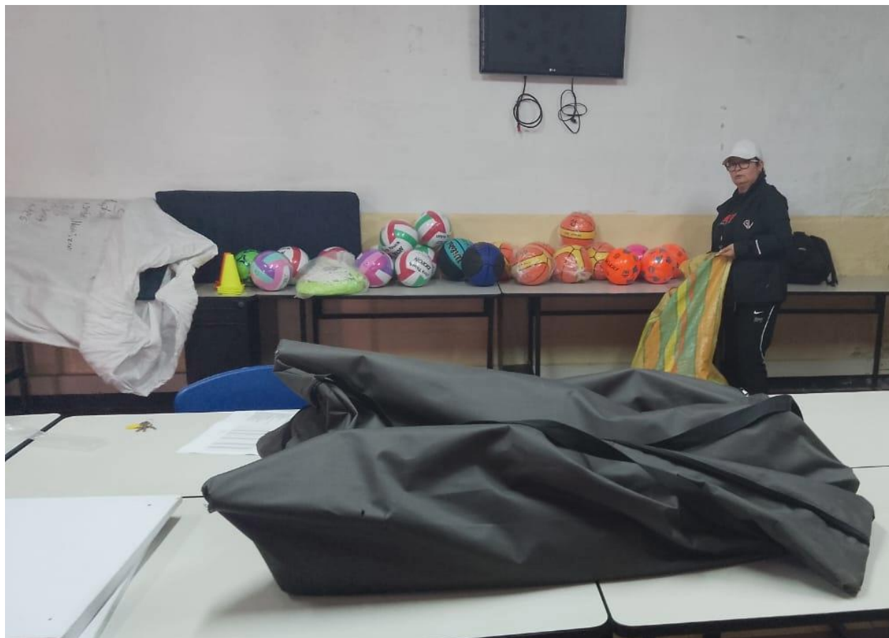
BALONES, COLCHONETAS, SET DE ENTRENAMIENTO

INFORME EJECUTIVO RENDICION DE CUENTAS 2025