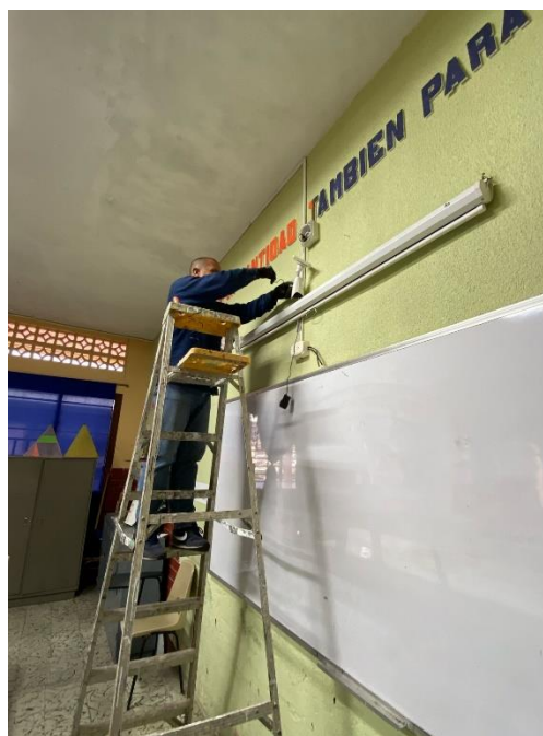
LABORATORIO DE FISICA