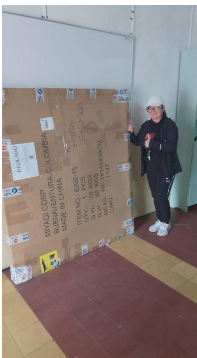
MESA DE TENIS