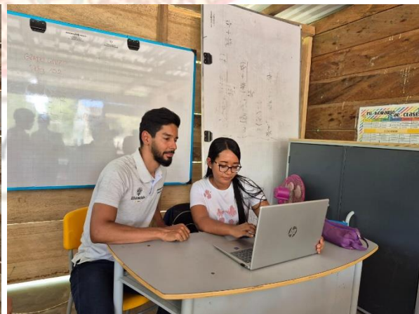
Reunión con la Docente Dinamizadora