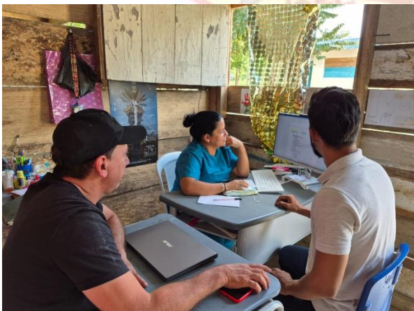
Reunión con D.D y Orientador