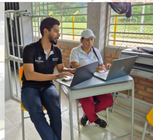
Reunión planeación de actividades