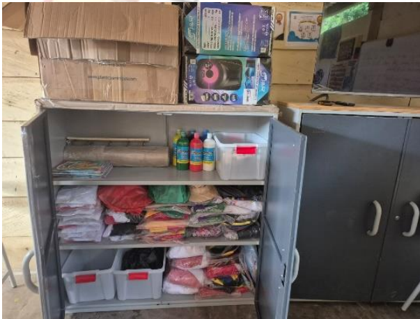
Material de DANZAS