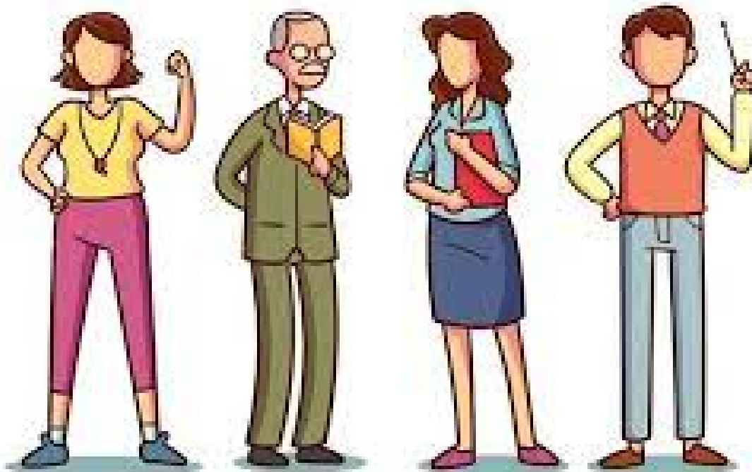
Figura 3 Docentes