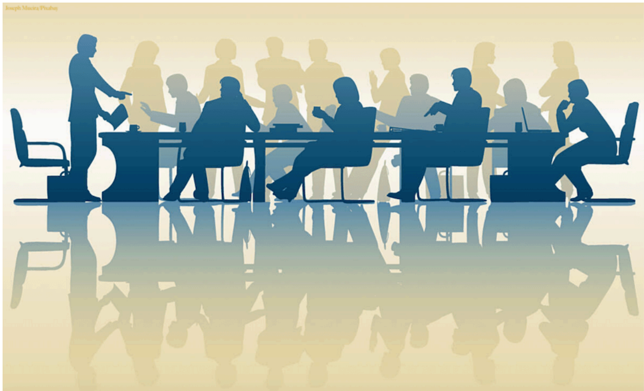
Figura 7 Consejo académico