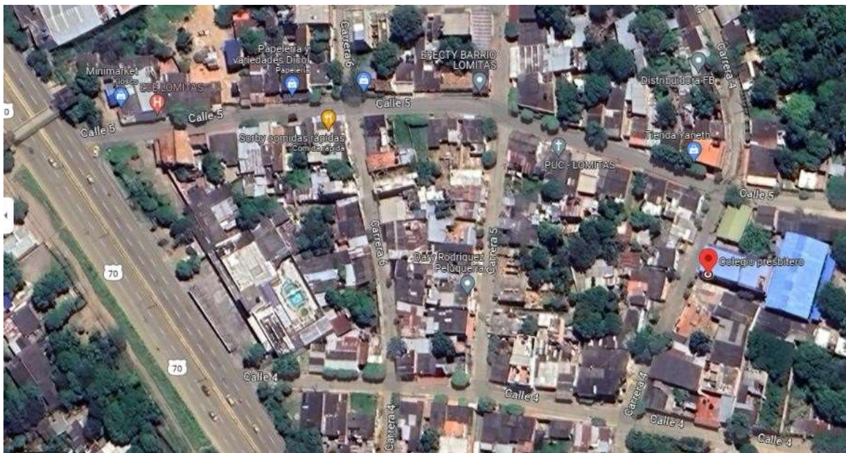
Figura 1. Ubicación en Google Maps, fotografía satelital.

Desde el año 2014 se está desarrollando un proceso continuo de mejoramiento del Proyecto Educativo Institucional y se ha consolidado un importante grupo de docentes, directivos docentes y personal administrativo, quienes atienden en las cuatro sedes respectivas a