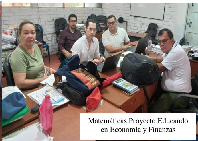
Matemáticas Proyecto Educando en Economía y Finanzas