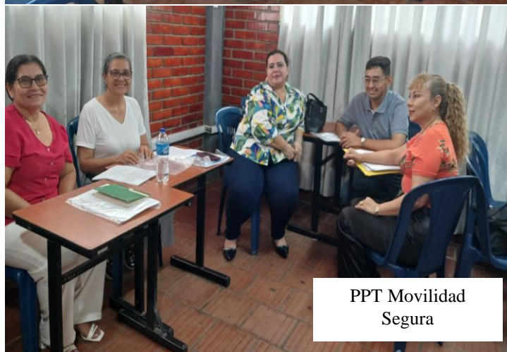
PPT Movilidad Segura