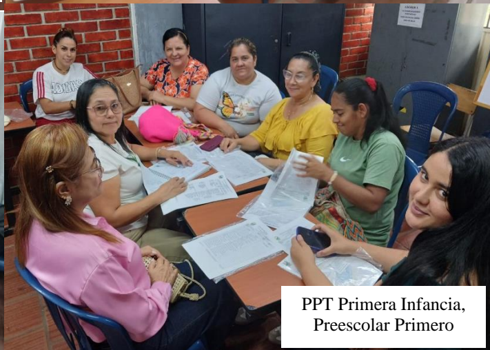
PPT Primera Infancia, Preescolar Primero