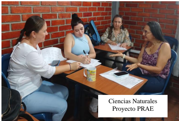
Ciencias Naturales Proyecto PRAE