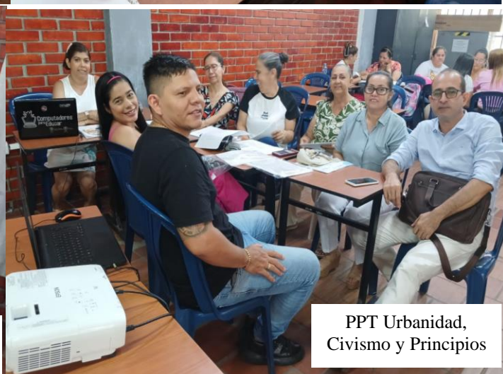
PPT Urbanidad, Civismo y Principios