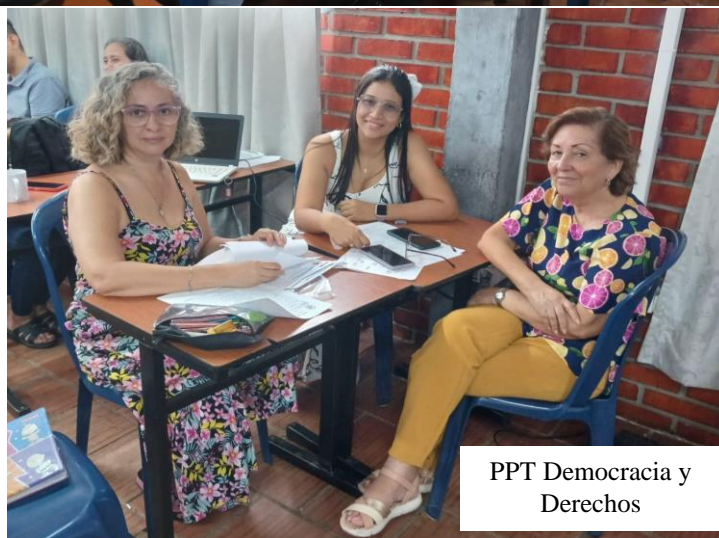
PPT Democracia y Derechos