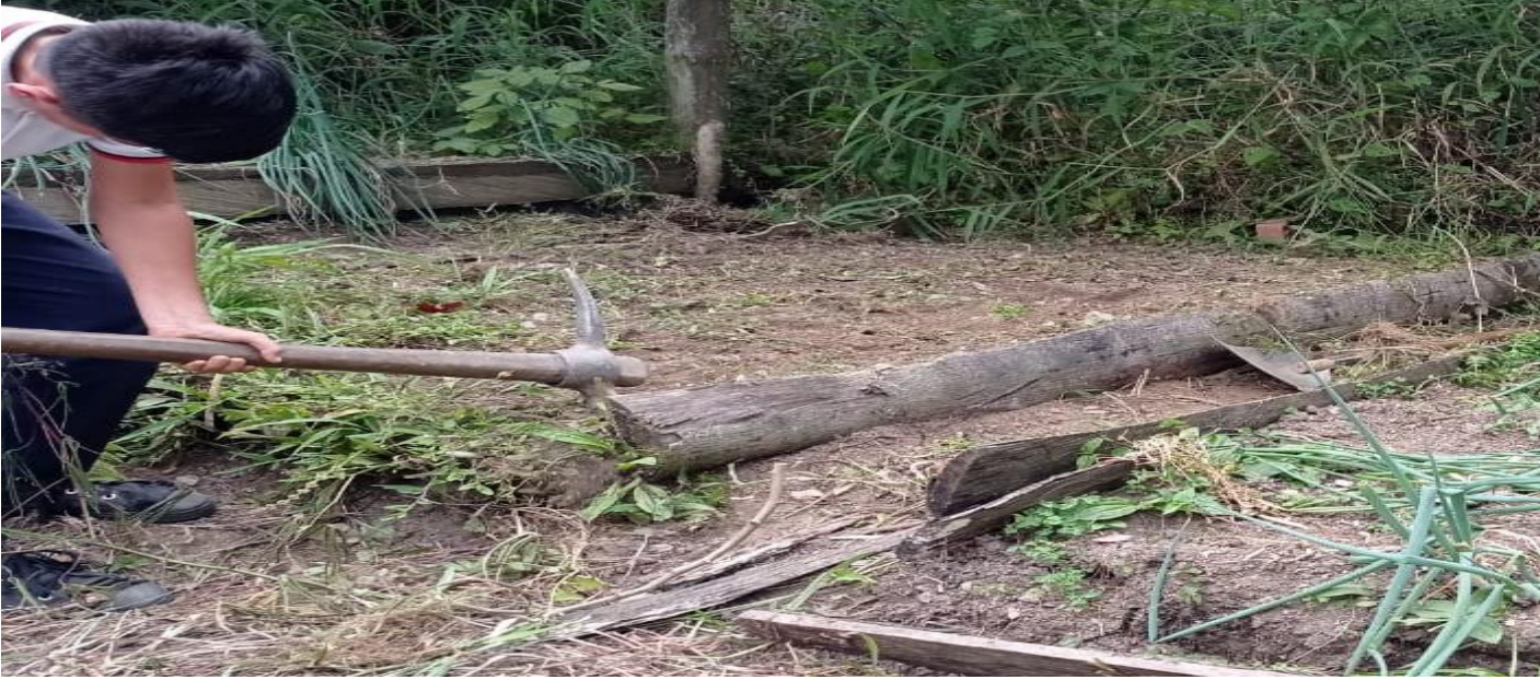
Quitando las malezas de la huerta