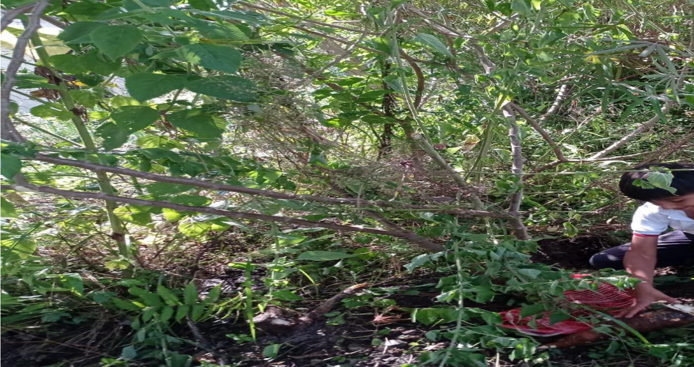
Cultivo de yuca