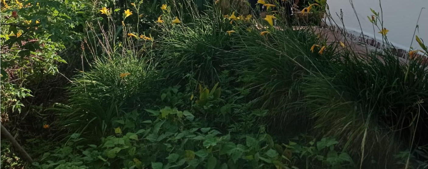
Cultivo de fríjol