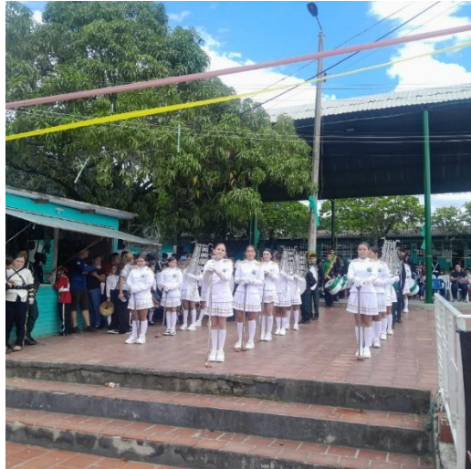
Proyección de dotación en instrumentos para la Banda