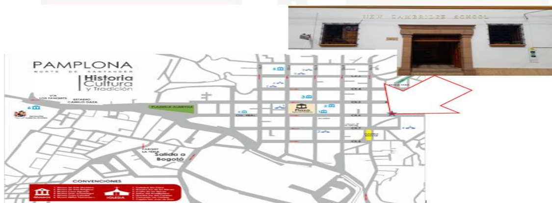
ILUSTRACIÓN UBICACIÓN GEOGRÁFICA DE LA INSTITUCIÓN EDUCATIVA NEW CAMBRIDGE SCHOOL

La institución educativa New Cambridge School, está ubicada en la carrera 6 N°2 – 20 El Humilladero en la ciudad de Pamplona, a una distancia aproximada de 74 kilómetros de la capital norte-santandereana. Cuenta con diferentes vías de acceso por tierra, la cual ha permitido tener un traslado fácil hacia el centro educativo.