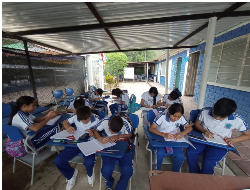
Primera edición del periódico con el nombre y las temáticas definidas.