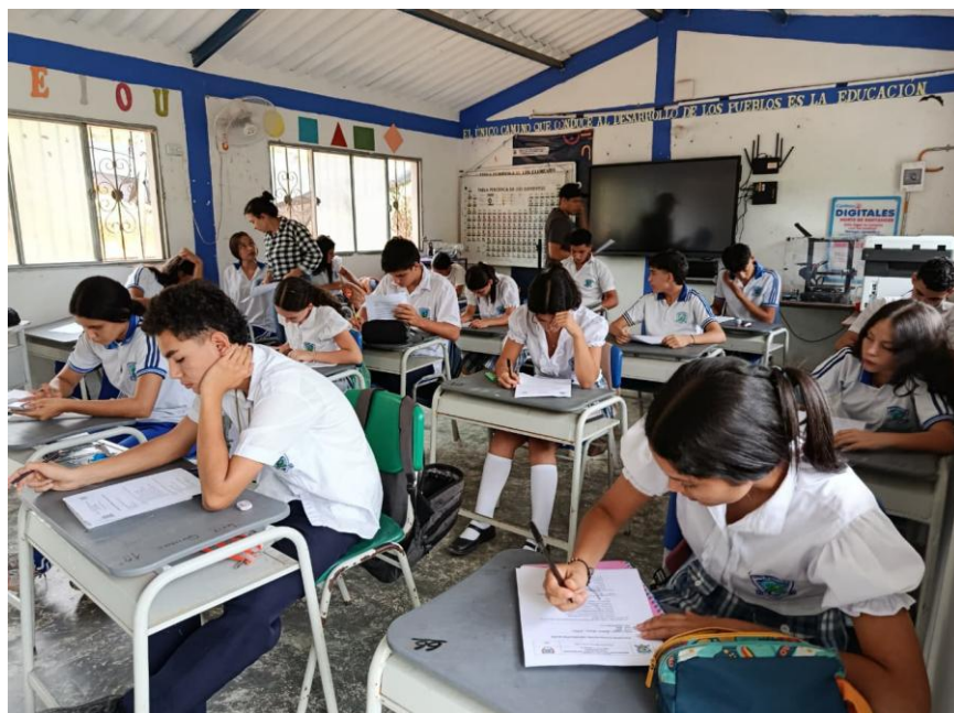
Reunión con estudiantes para construir el nombre y los temas para la propuesta.