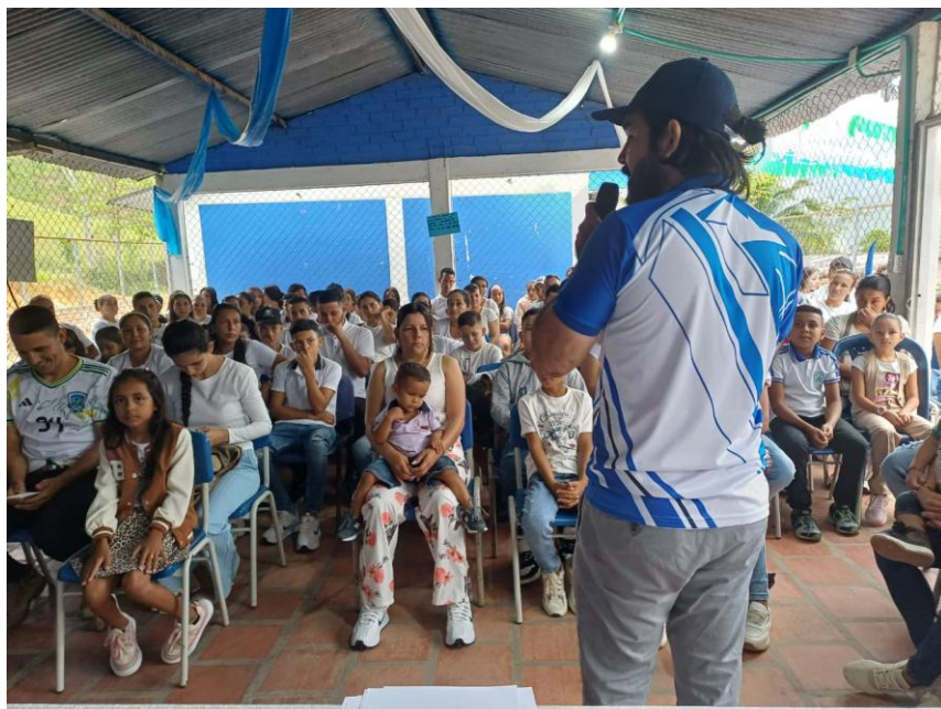
Reunión con estudiantes y docentes para la organización de la propuesta.