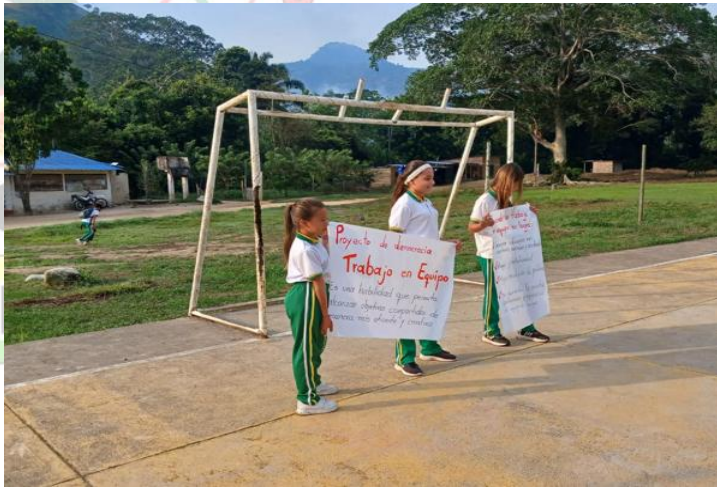
TRABAJO EN EQUIPO