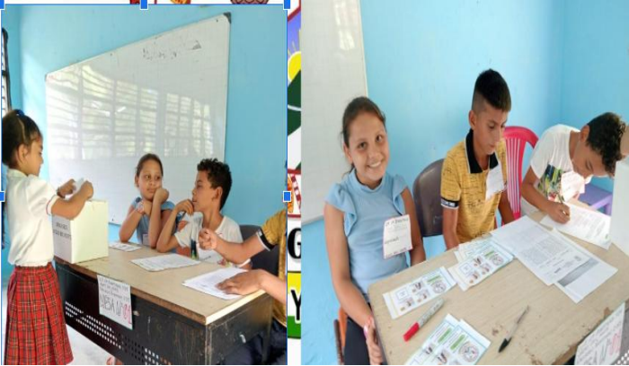
ELECCION DEL PERSONRERO