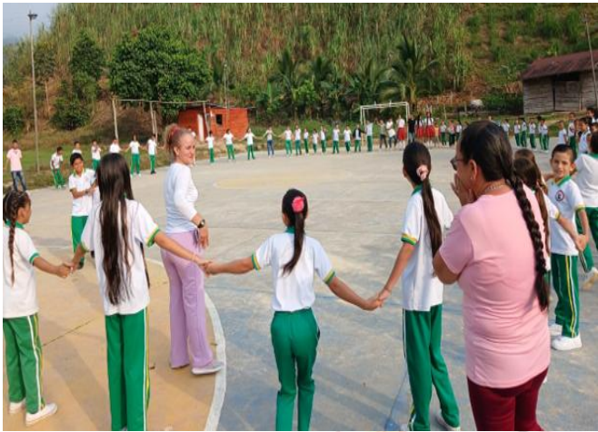
CER LA BOGOTANA "Trabajo en equipo". Se motiva en los estudiantes el valor de la "Creatividad"