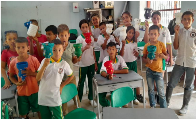
Valor de la creatividad en democracia