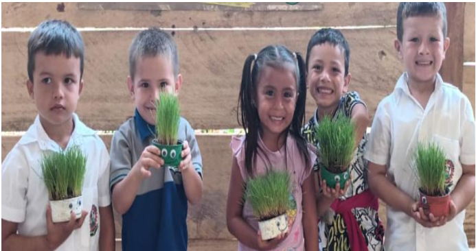
Valor de la creatividad en democracia