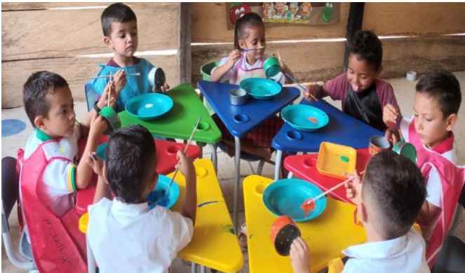
Valor de la creatividad en democracia