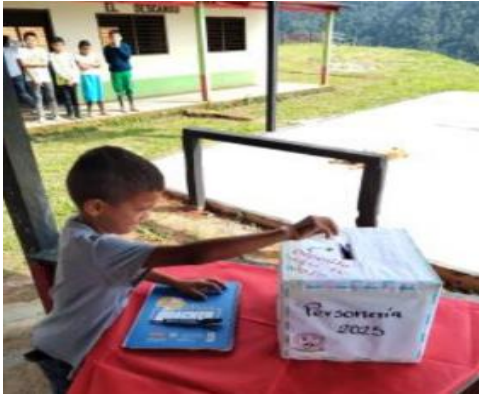
ELECCION DEL PERSONERO