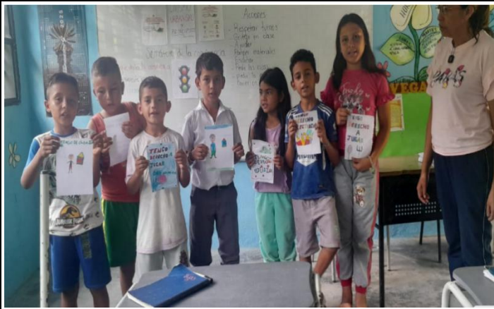
Trabajar en los estudiantes el valor de la "Prudencia" DERECHO A JUGAR