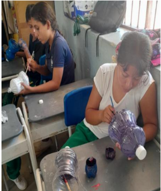
Valor de la creatividad en democracia