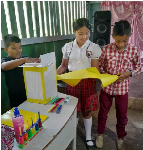
ELECCION DEL PERSONERO