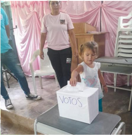
ELECCION DEL PERSONERO