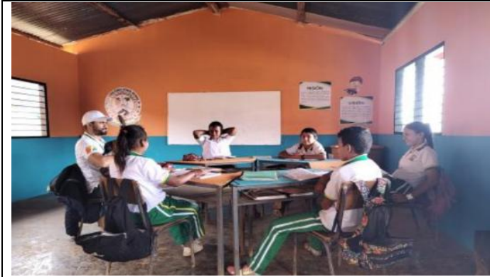
Pacto De Convivencia