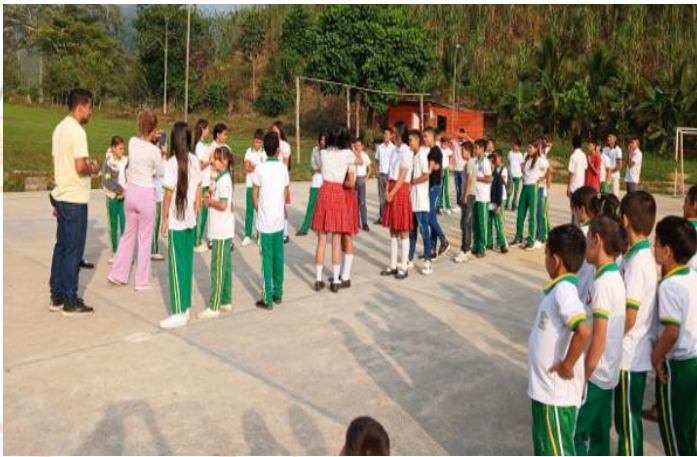
CER LA BOGOTANA