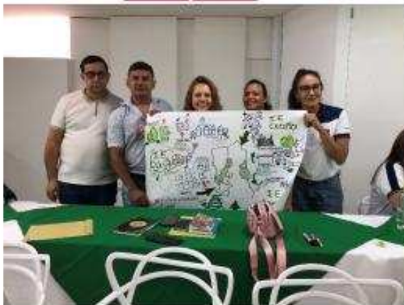
Capacitación CENS- Cúcuta