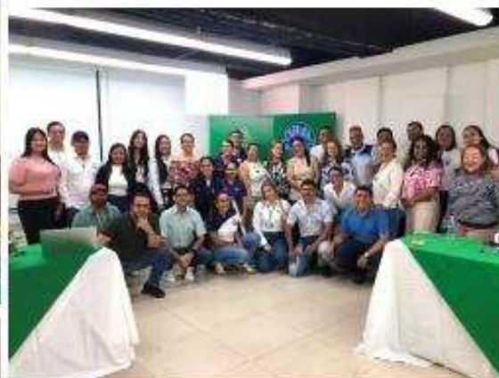
Charla: Cuidamundos CENS