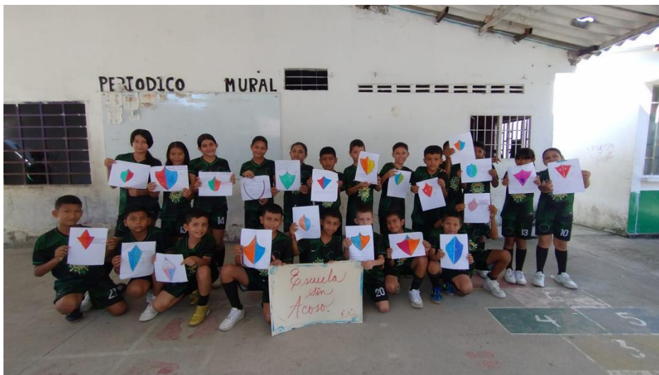
Imagen 3 Montañez, R. E. (2025). Acoso escolar [El escudo protector contra el acoso escolar].

Objetivo: Fomentar la reflexión y la expresión creativa de los estudiantes sobre cómo protegerse y proteger a otros del acoso escolar, promoviendo valores como el respeto, la empatía y la convivencia pacífica.