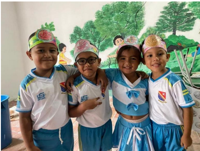
Imagen 1 Argoty López, Á. G. (2025). Acoso escolar [No mas Bullying].

Objetivo: Concientizar a los estudiantes sobre la importancia del buen trato y rechazar el acoso