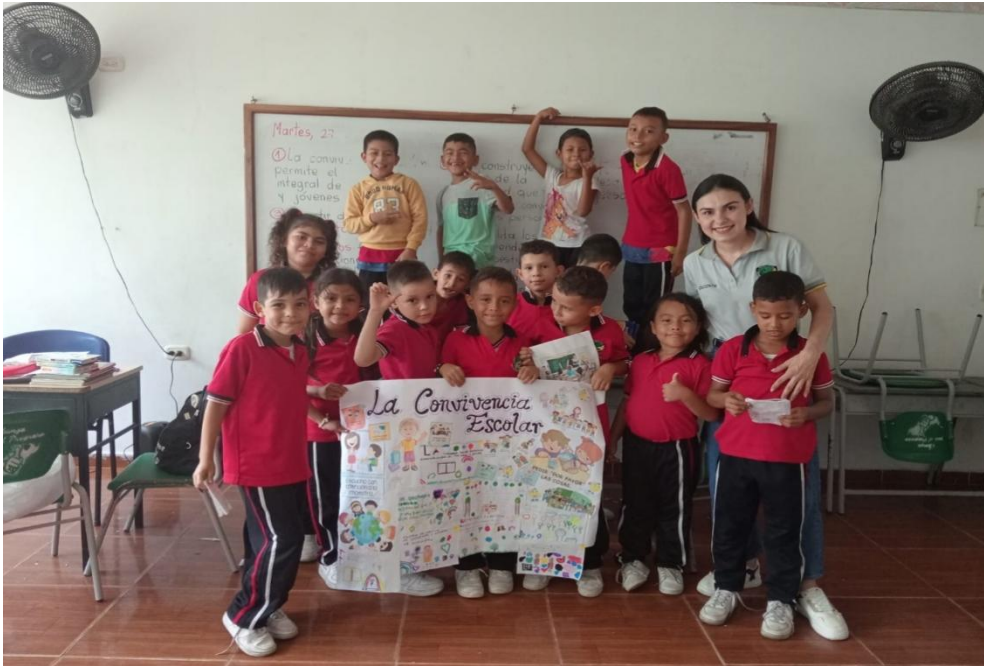
Ilustración 3: Solano Santiago, L. (2024). Cartelera gráficas alusivas a las normas de convivencia [Fotografía de estudiantes con cartel sobre convivencia escolar]

REPUBLICA DE COLOMBIA DEPARTAMENTO NORTE DE SANTANDER CENTRO EDUCATIVO RURAL EL TROPEZON Municipio La Esperanza Dane: 254128001028 NIT:900253672