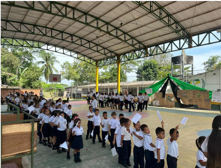
Imagen 7 Baldion , T. L. (2025). la Escuela Territorio de Paz [Marcha de la paz].

Objetivo: Promover la paz y la seguridad en el entorno escolar mediante una marcha simbólica en la que se hizo un llamado a los grupos al margen de la ley para que se mantengan alejados de las instituciones educativas del departamento de Norte de Santander, reafirmando el compromiso de la comunidad educativa del C.E.R. El Tropezón con la protección de la niñez, la convivencia pacífica y el derecho a una educación libre de violencia.