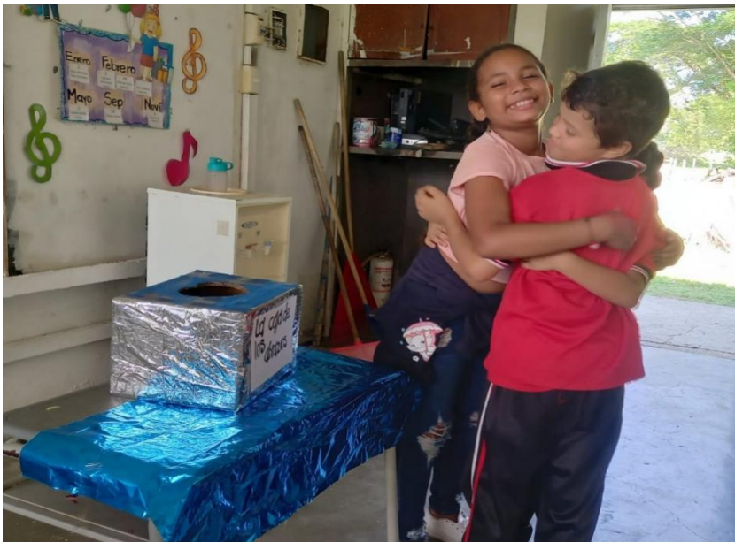
Ilustración 8: Flórez Sánchez, A. (2024). La caja de los abrazos [Actividad educativa].