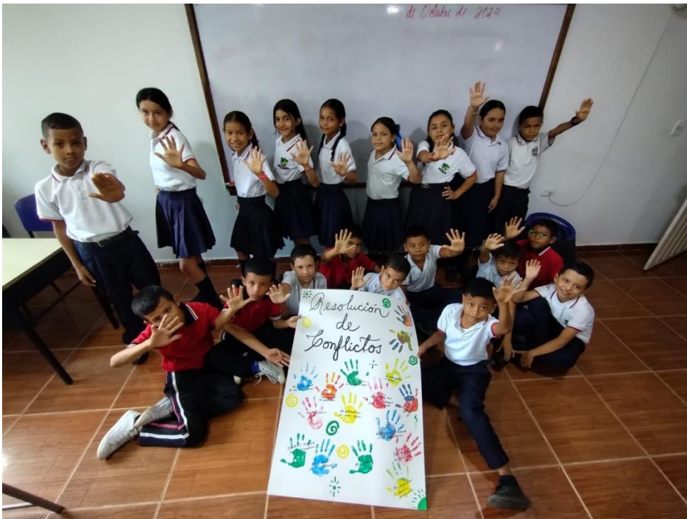
Ilustración 4: Montañez Parra, R. (2024). Discusión sobre la resolución de conflictos [Cartel].