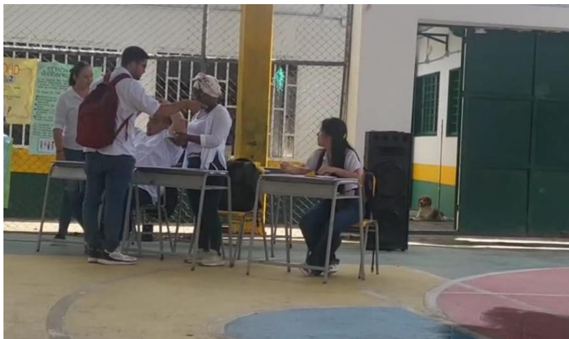
Imagen 8 Baldion , T. L. (2025). la Escuela Territorio de Paz [Obra de teatro realizada por los docentes].

REPUBLICA DE COLOMBIA DEPARTAMENTO NORTE DE SANTANDER CENTRO EDUCATIVO RURAL EL TROPEZON Municipio La Esperanza Dane: 254128001028 NIT:900253672