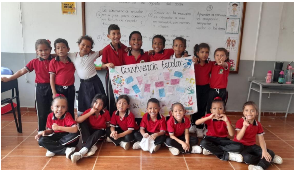
Ilustración 2: Villa Amaya, Y. (2024). Convivencia escolar [Fotografía de estudiantes con cartel sobre convivencia escolar].