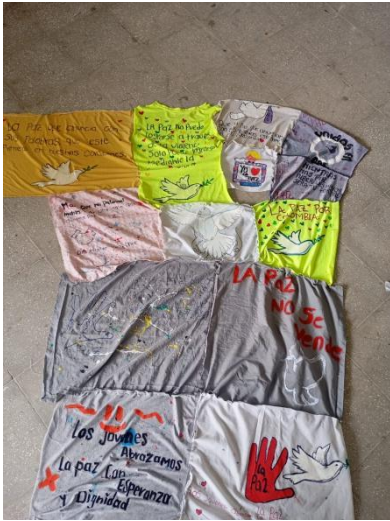
Imagen 5 Baldion , T. L. (2025). La Escuela Territorio de Paz [Tapete de la paz].

REPUBLICA DE COLOMBIA DEPARTAMENTO NORTE DE SANTANDER CENTRO EDUCATIVO RURAL EL TROPEZON Municipio La Esperanza Dane: 254128001028 NIT:900253672