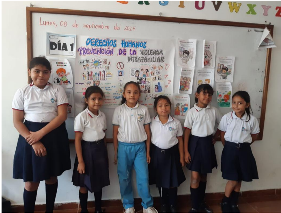
Imagen 4 Solano, L. F. (2025). Derechos Humanos y Prevención de la violencia intrafamiliar [Mural].

REPUBLICA DE COLOMBIA DEPARTAMENTO NORTE DE SANTANDER CENTRO EDUCATIVO RURAL EL TROPEZON Municipio La Esperanza Dane: 254128001028 NIT:900253672