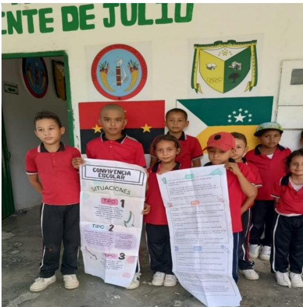
Ilustración 6: Ramírez Collante, Y. (2024). Convivencia escolar [Póster].