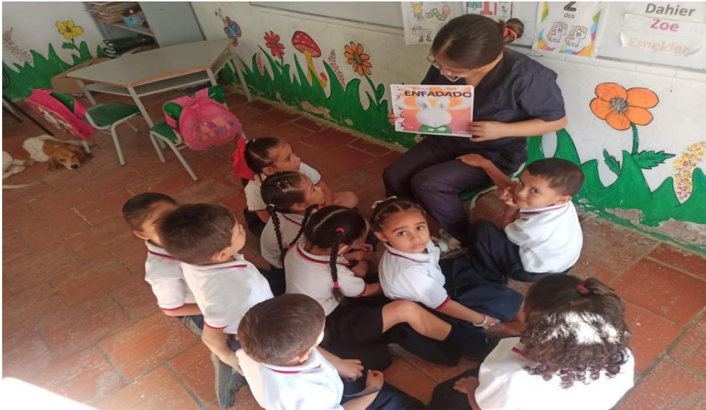
Ilustración 1: Argoty López, Á. G. (2024). Convivencia escolar [Literatura infantil para el desarrollo socioafectivo].