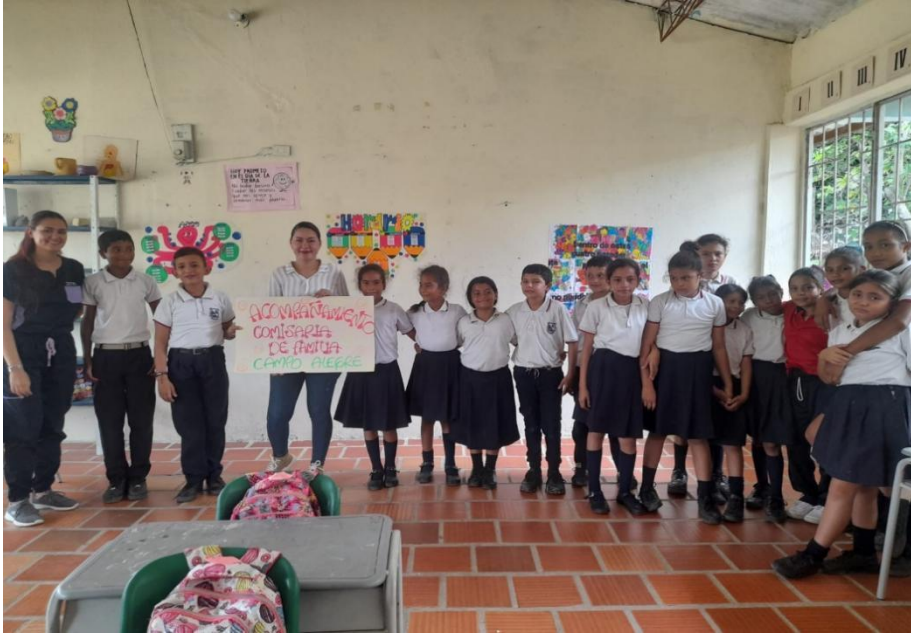
Ilustración 7: Niño Villamizar, M. (2024). Vinculación de la comisaría de familia de La Esperanza en la convivencia escolar [Actividad educativa].

REPUBLICA DE COLOMBIA DEPARTAMENTO NORTE DE SANTANDER CENTRO EDUCATIVO RURAL EL TROPEZÓN Municipio La Esperanza Dane: 254128001028 NIT:900253672