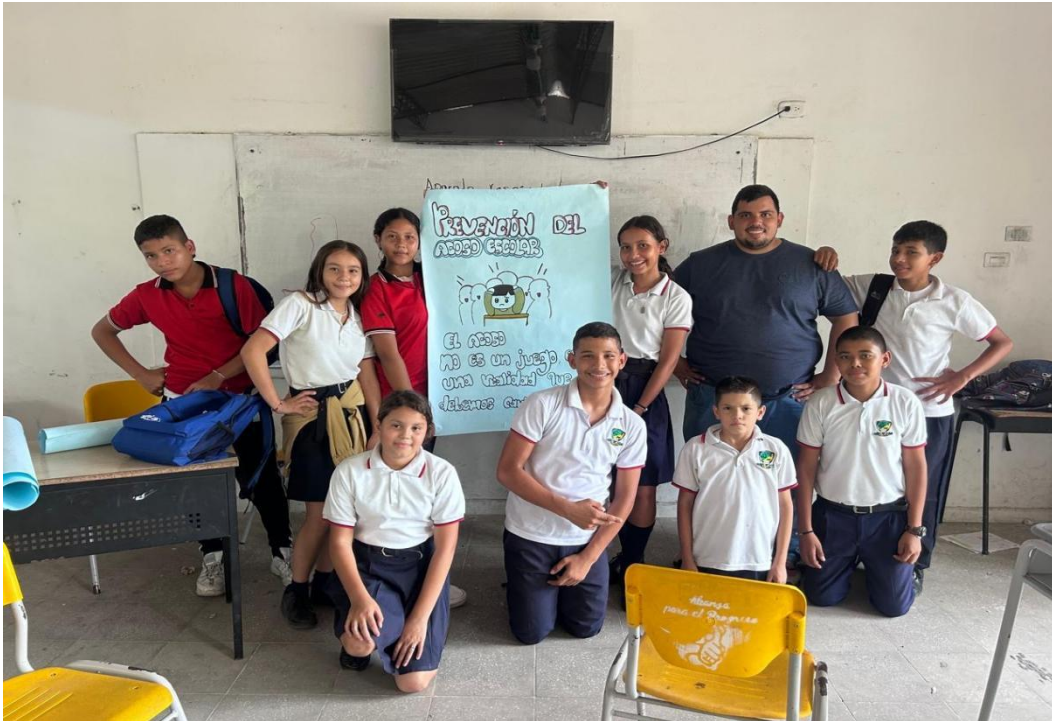
Ilustración 5: Riveros Carrillo, V. (2024). Estrategias que fomentan un ambiente escolar armónico y seguro [Cartelera].

REPUBLICA DE COLOMBIA DEPARTAMENTO NORTE DE SANTANDER CENTRO EDUCATIVO RURAL EL TROPEZÓN Municipio La Esperanza Dane: 254128001028 NIT:900253672