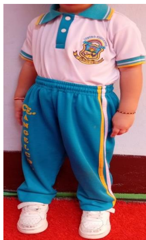
Tenis blancos y Media larga blanca