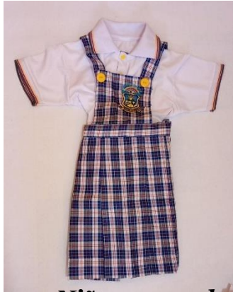
Niña preescolar y primaria