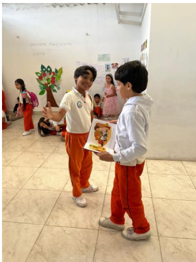
Juego cooperativo (mímica, como respetar los derechos) “cumplamos derechos”